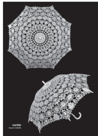
Parasolka - wykonanie: Lucyna Bytow

1 września w Pawilonie Wystawowym w Parku Staszica odbył się wernisaż wystawy pokonkursowej i ogłoszenie wyników. Wśród nagrodzonych znalazły się nasze reprezentantki.