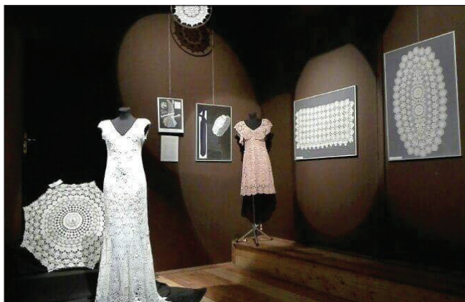
Wystawa „Jej wysokość koronka koniakowska”

Jarmark Jagielloński w Lublinie to zdecydowanie miejsce i czas, gdzie można zachwycić się wciąż żywą tradycją. Na wydarzeniu prezentowana jest starannie wyselekcjonowana sztuka ludowa rzemieślników z Europy Środkowo-Wschod-