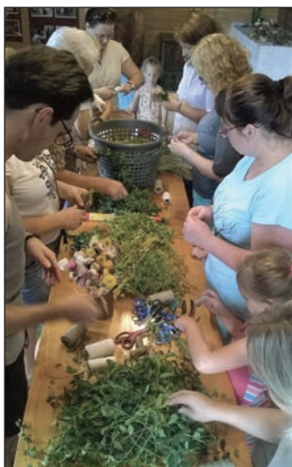
Warsztaty wicia wieńców i wianków.

Warsztaty wicia wieńców i wianków. Warsztaty prowadziła Lucyna Bytow.