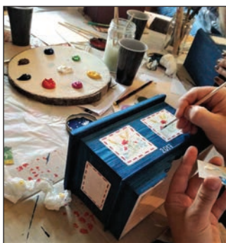
Warsztaty malowania tróchły.