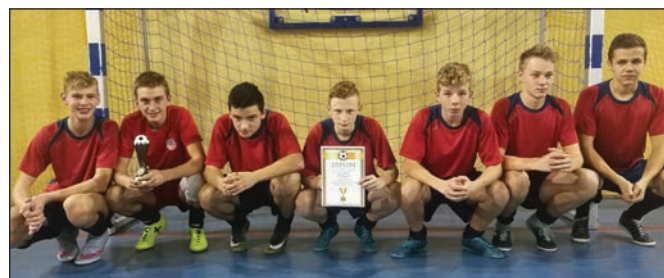
Juniorzy APN Góral na turnieju w Kaczcach

* Drużyny juniorów i trampkarzy stanęły na podium w rozegranym w Kaczcach I Halowym Turnieju Piłki Nożnej Juniorów i Trampkarzy im. Andrzeja Morawca.