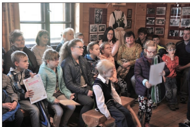
Konkurs Jako sie matka za tacika wydowali.

By zachęcić dzieci i młodzież do zgłębienia tematu, na początku marca 2017 r. ogłoszono konkurs pt. „Jako sie matka za tacika wydowali” . Zadaniem uczestników było przeprowadzenie wywiadu z babcią lub dziadkiem, dopytanie ich, jak kiedyś wyglądały chrzciny, komunie, wesele lub pogrzeb. Na podstawie takiego wywiadu uczestnicy musieli przygotować pracę literacką, którą mogli uzupełnić o pamiątki rodzinne i stare fotografie.