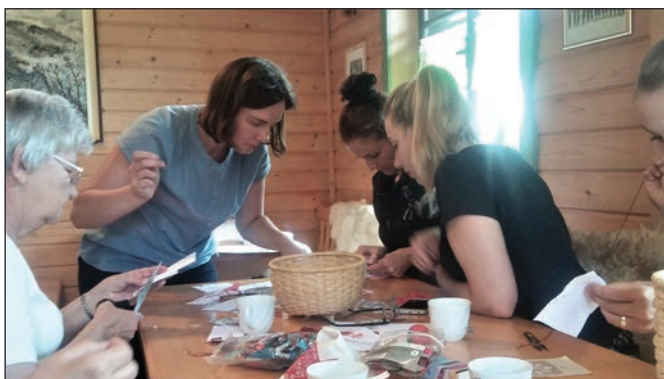
Warsztaty haftu.