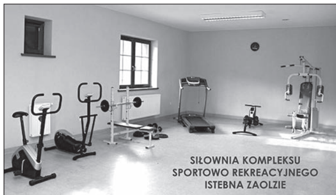
SIŁOWNIA KOMPLEKSU SPORTOWO REKREACYJNEGO ISTEbNA ZAOLZIE