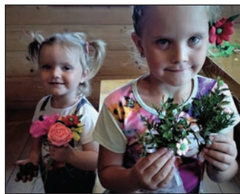
Warsztaty robienia wóńiónczek i bibułkowych kwiatków.

W dniu 28.10.2017r. w Muzeum „Na Grapie” odbyła się prelekcja naukowa poświęcona tematyce obrzędowości ro-