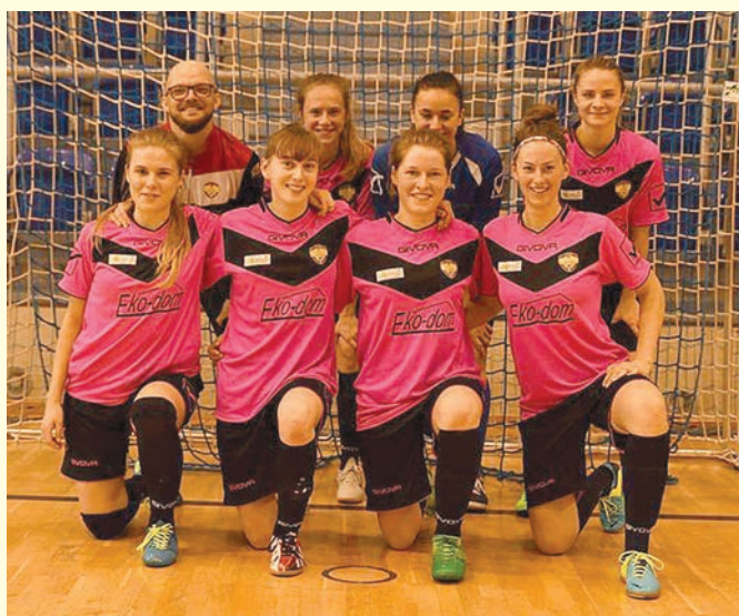
Awans piłkarek UKKS Istebna w Pucharze Polski w futsalu!