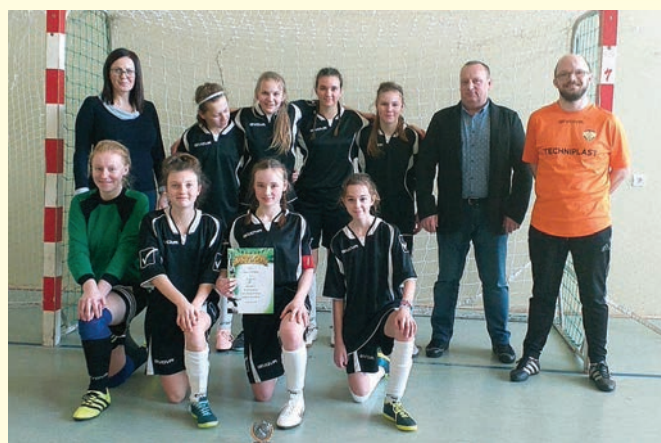
Drużyna UKKS Istebna z trenerem i władzami Gminy