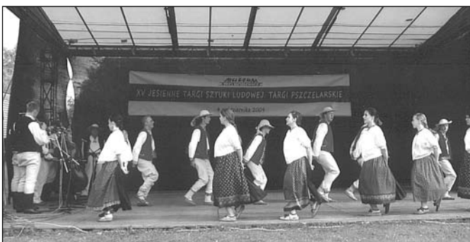
Zespół „Koniaków” na Targach Pszczelarskich w Opolu