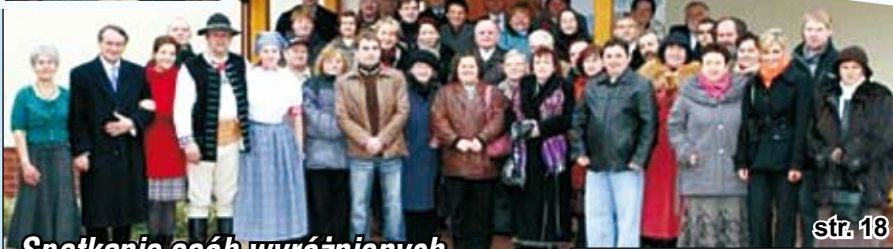
Spotkanie osób wyróżnionych certyfikatem „Beskidzki produkt na 5 o ”