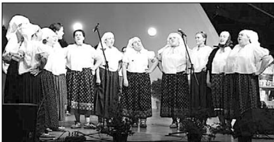
Występ Zespołu „Koniaków” podczas TKB

Zapraszam 6 lutego 2010 na XVII Bal Góralski w gospodzie Pod Ochodzitą z udziałem kapeli ludowych i zespołów krajowych i zagranicznych.