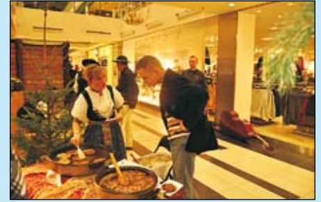
Kuchnia Regionalna w Warszawie