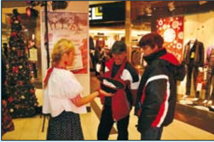
Goście w galerii