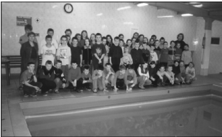
Uczniowie ze SP nr 2 z Koniakowa_Rastoki na zimowisku w Gimnazjum nr 5 w Studzionce

gdzie pod czujnym okiem ratownika zdobywali umiejętności pływackie. Dzieci uczestniczyły również w wycieczce do Pszczyny, zwiedzając między innymi Muzeum Prasy Śląskiej oraz