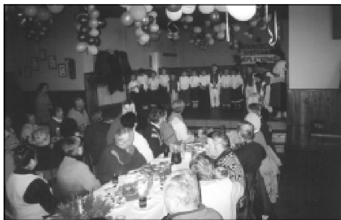
Spotkanie opłatkowe seniorów we wsi Jaworzynka