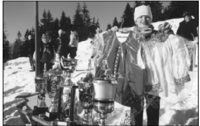
Wyniki XXVIII Międzynarodowego Biegu Narciarskiego "O Istebniański Bruclik" - na str. 10