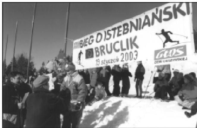
Wójt oraz Przewodniczący Gminy wręczają nagrody w kategoriach dzieci