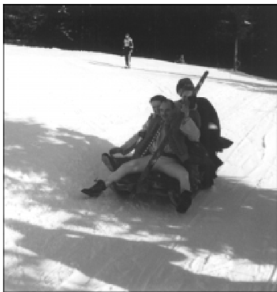
Zespół regionalny "Istebna" pokazywał na jakim sprężcie jeździło się dawniej. Kibice też próbowali