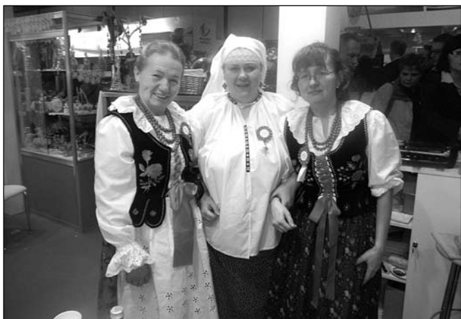
Targi Grune Woche w Berlinie

W dniach 20 – 29 stycznia odbyły się w Berlinie jedne z największych targów żywności na świecie, w których udział wzięła także gmina Istebna. W targach udział wzięło Stowarzyszenie – LGD „Żywiecki Raj”, które reprezentowało nasze LGD i Polskę podczas 77 Międzynarodowych Targów Gospodarki Żywnościowej, Rolnictwa i Ogrodnictwa „GrüneWoche” w Berlinie. Swoje produkty prezentowali wystawcy z 59 krajów z całego świata.