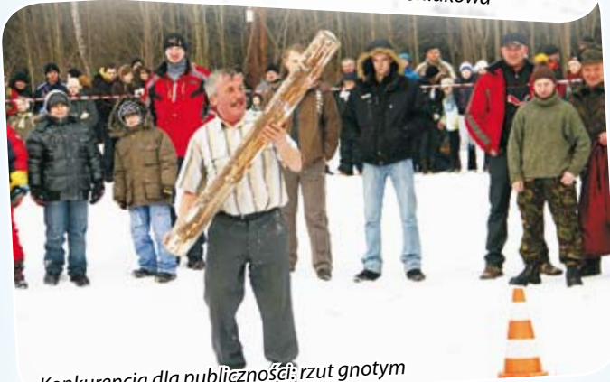
Konkurencja dla publiczności: rzut gnotym