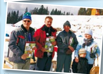
Wolontariusze obsługujący imprezę