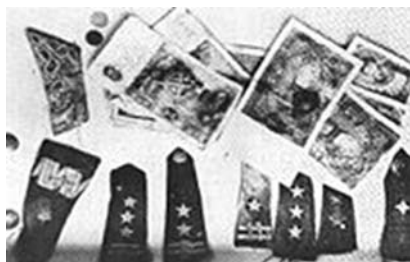
Polskie banknoty i epelety znalezione w badanych mogiłach

Wiadomo kto brał udział w przygotowaniu i egzekucjach Polaków, zachował się bowiem wydany 26 października 1940 r. roz-