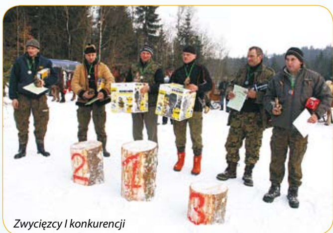
Zwycięzcy I konkurencji