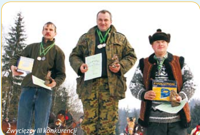
Zwycięzcy III konkurencji

Z okazji Dnia Kobiet pragnę wszystkim kobietom złożyć życzenia wszystkiego najlepszego, zdrowia, szczęścia, spełnienia marzeń.