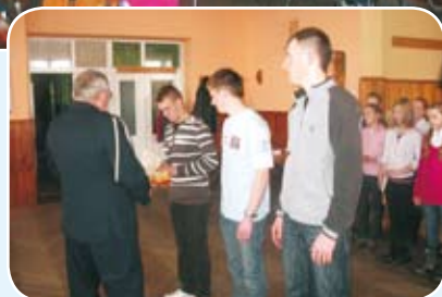
Wręczenie nagród grupie III