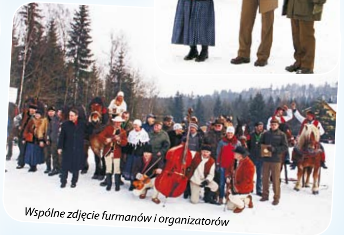
Wspólne zdjęcie furmanów i organizatorów