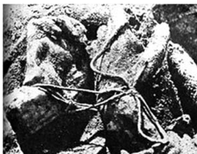
Węzeł katyński - ręce związane na plecach ofiary