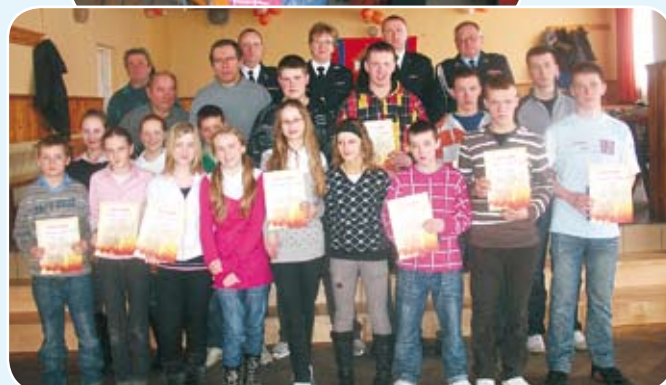
Uczestnicy konkursu z opiekunami