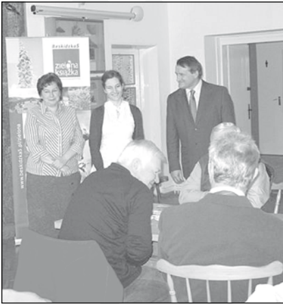
Prowadząca konferencję i władze gminy

W dniu 4 marca 2010 roku w Ośrodku Edukacji Ekologicznej w Istebnej odbyło się spotkanie promujące publikację Zielona Księga Beskidzkiej 5 . Na spotkaniu zaprezentowano publikację „Osobliwości i atrakcje przyrodnicze Beskidzkiej 5. Zielona Księga Beskidzkiej 5” wydaną przez Stowarzyszenie Wspierania Inicjatyw Gospodarczych DELTA PART-