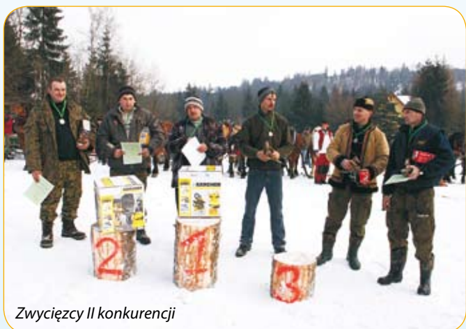
Zwycięzcy II konkurencji