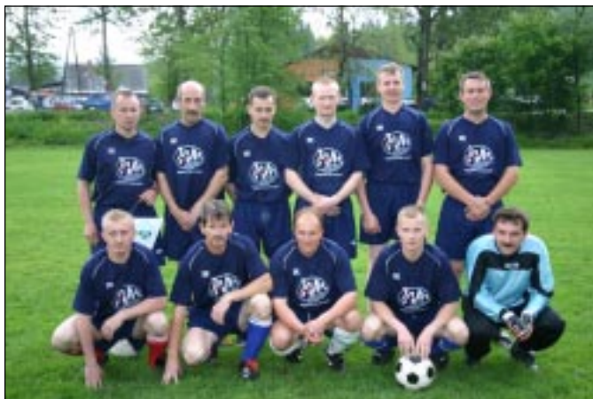
Drużyna Urzędu Gminy Istebna

W sobotę 12 czerwca 2004 w ramach imprezy z okazji 10 lecia firmy Lys Fusion rozegrano na boisku Pod Skocznią towarzyski mecz, w którym zespół reprezentujący jubilata spotkał się z drużyną Urzędu Gminy Istebna. W obu drużynach wystąpiło również gościnnie kilku piłkarzy nie związanych z rywalizującymi ekipami. Mimo kiepskiej pogody i namokniętego