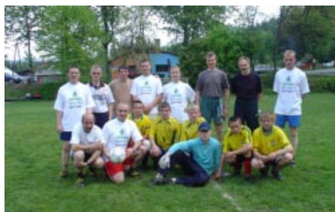
Nauczyciele i uczniowie przed meczem