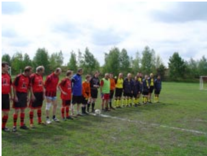
W oczach przeciwników widać strach

W dniu 8 maja 2004 w Zabrze – Makoszowy zostały rozegrane Mistrzostwa Śląska Pracowników Oświaty w piłce nożnej 6 – osobowej na boiskach trawiastych. Wzięli w nich udział także nauczyciele i pracownicy obsługi Gimnazjum w Istebnej. Dzielnie walcząc z wyżej notowanymi drużynami zajęli 5 miejsce a za sportową postawę otrzymali puchar Fair Play. Impreza była świetnie zorganizowana. Poniżej zdjęcia z tego wydarzenia: