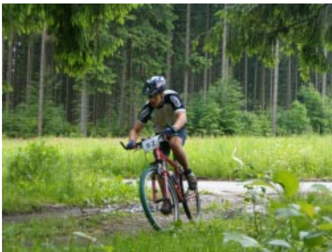
Na trasie w okolicach Wilczego

towa i organizacyjna część imprezy stała na wysokim poziomie, pomimo skromnego budżetu imprezy (wpisowe wynosiło tylko 7 zł). Fakt ten potwierdzają opinie prawie wszystkich zawodników, którzy jednoznacznie wyrazili swoje uznanie za fa-