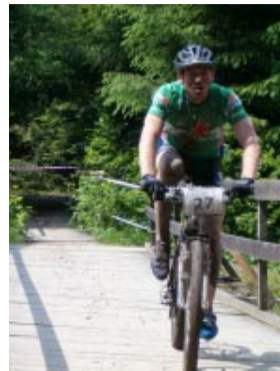
Kładka na rz. Olza i upragniony zjazd z pętli na meta