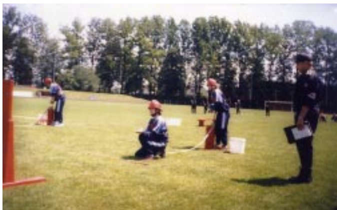
Dziewczęta w akcji, walczą w bojuwce