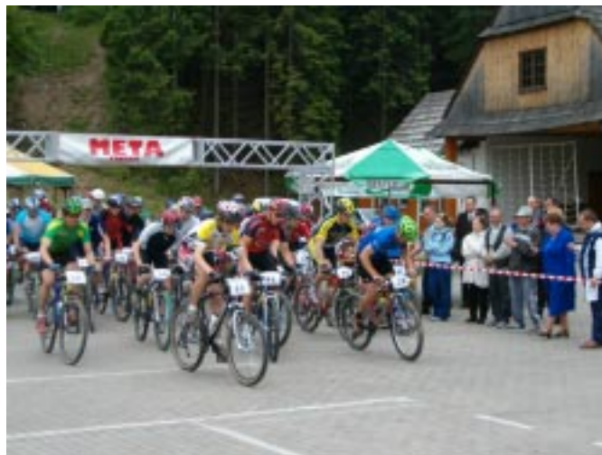
Start wspólny męskich kategorii

Piękna, słoneczna pogoda i grząskie błoto towarzyszyło 55 zawodniczkom i zawodnikom w pierwszych Otwartych Zawodach w Kolarstwie Górskim XC o Puchar Wójta Gminy Istebna, które odbyły się w niedzielę, 13 czerwca br. na trasie wyty-