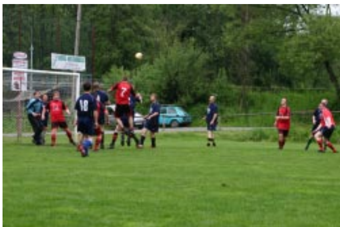
Ich wielu – ona / piłka / jedna