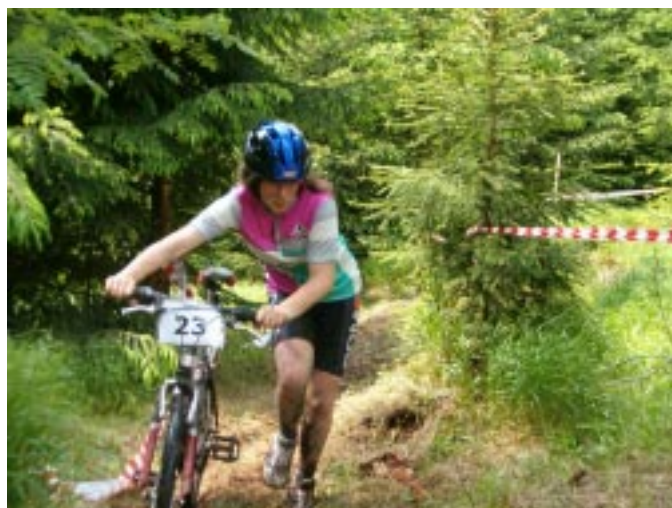
Czasem lepiej prowadzić rower