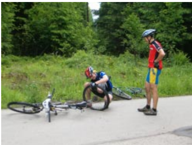
Defekty również się zdarzały

chową organizację, a zwłaszcza doskonale przygotowaną trasę wyścigu obfitującą we wszystko, co powinna posiadać profesjonalna trasa cross country, a więc: podjazdy, zjazdy, odcinki szerokie, wąskie no i wszechobecne błoto dające się we znaki szczególnie tym, którzy na co dzień nie trenują w tak ciężkich