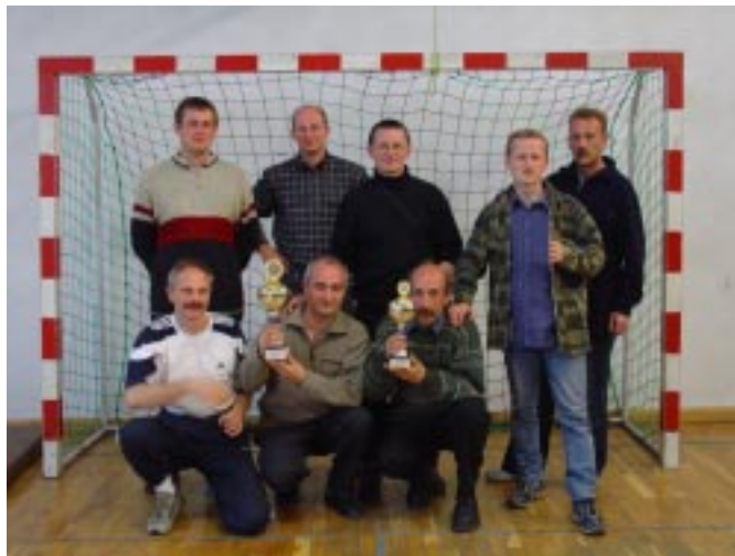
Warto było grać!