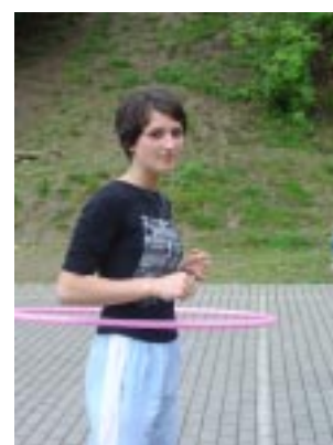
Zwyciężczynie hula – hop

Impreza była bardzo udana również za sprawą pogody, która akurat w tym dniu dopisała.