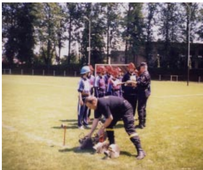
Ostatnie chwile przed startem drużyny dziewcząt

pizzerni „U Kruka” w Koniakowie za ufundowanie pizzy za wodnikom i ich opiekunom. Składamy podziękowania opiekunom za przygotowanie drużyn do zawodów, komendantowi gminnemu za załatwienie autobusu na przejazd na zawody, a młodemu zawodnikom startującym w tych zawodach gratulujemy ich wytrwałości i życzymy dalszego zapału i chęci do przygotowania się do następnych zawodów sportowo-pożarniczych.