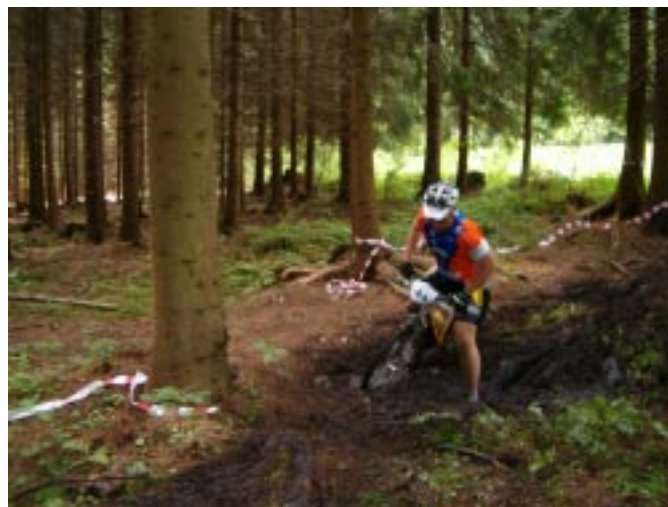
Szczególnie trudne i błotniste były odcinki leśne