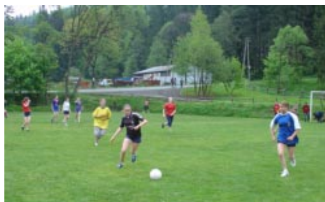
I kto powiedział, że dziewczyny nie umieją grać w piłkę