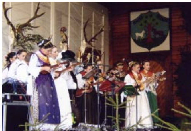
Występy zespołu „Gotalinka” w amfiteatrze „Pod Skocznią”

możliwość uczestniczenia w zajęciach z kół koronczarskiego, hafciarskiego, bibułkarskiego i nauki tańca wspólnie z zespołem „Mały Koniaków”. Dzieci z ogromnym zapałem wzięły się do wykonywania prac manualnych pod czujnym okiem instruk-