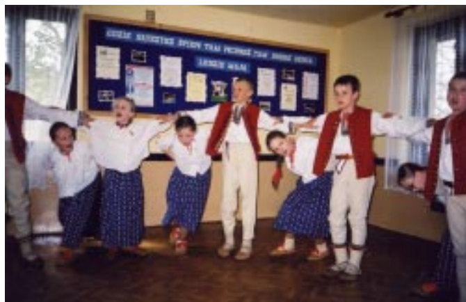
Pokaz tańca dla Białorusinów prezentuje „Mały Koniaków”

torów. 29 maja miały okazję wędrować po turystycznym szlaku na Stecówkę. Dla większości dzieci była to pierwsza górską wędrowka w życiu, bowiem w Białorusi nie ma gór.