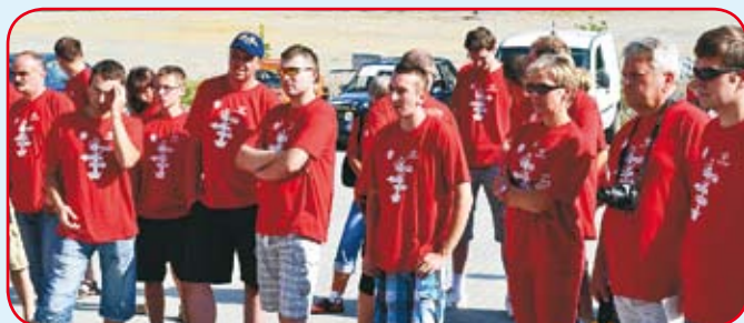
Odprawa przed startem