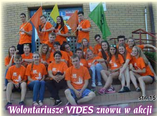
Wolontariusze VIDES znowu w akcji str. 15

140 lat Szkoły Podstawowej w Koniakowie Rastoce