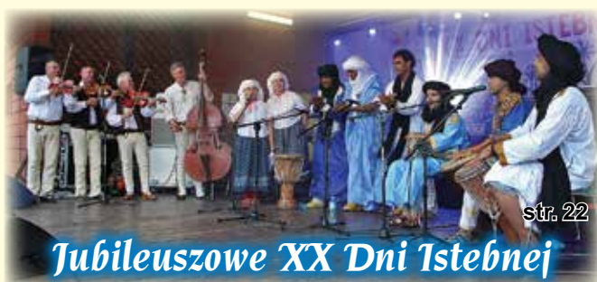
Jubileuszowe XX Dni Istebnej str. 22