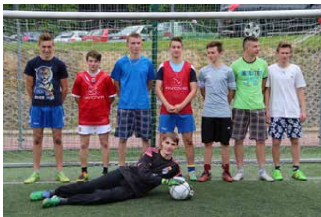
Prosto z kościoła