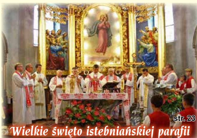
Wielkie święto istebniańskiej parafii str. 23