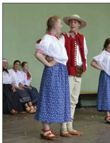
Przeгляд Wiejskich Zespołów Artystycznych w Brennej

W ciągu ostatniego miesiąca Zespół Regionalny Koniaków uczestniczył w kilku wydarzeniach, które promowały nasz rodzimy folklor w kraju i za granicą.