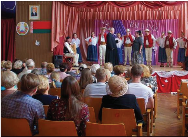
W Gorodcu na Białorusi