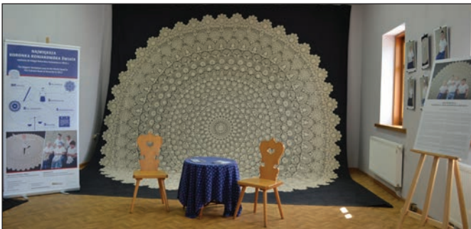
Rollup i tablice wystawowe