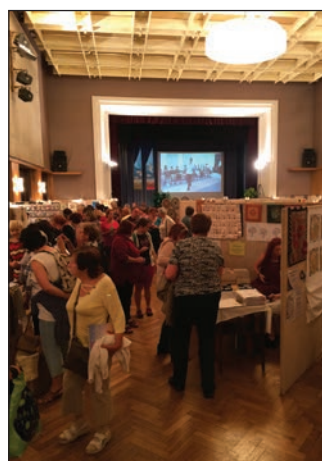
Festiwal Koronek w Vamberku