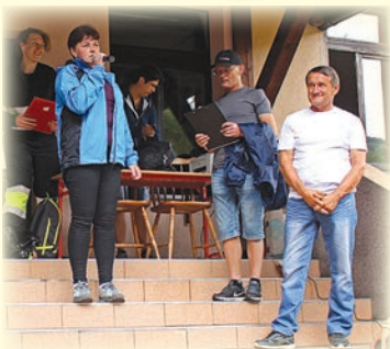
Otwarcie Biegu w Szkole Podstawowej w Rastoce