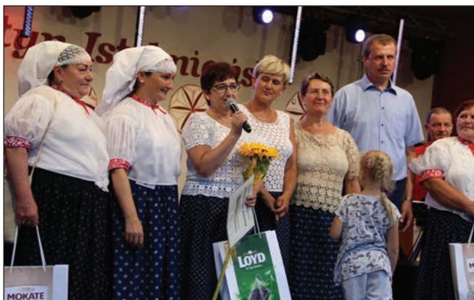
Panie z KGW w Koniakowie