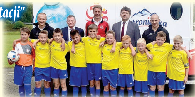
Nasze drużyny z trenerami i gośćmi