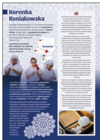
Ulotka o koronkach koniakowskich