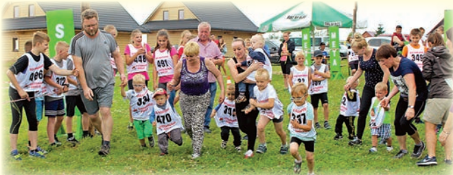
Start kategorii najmłodszych dzieci