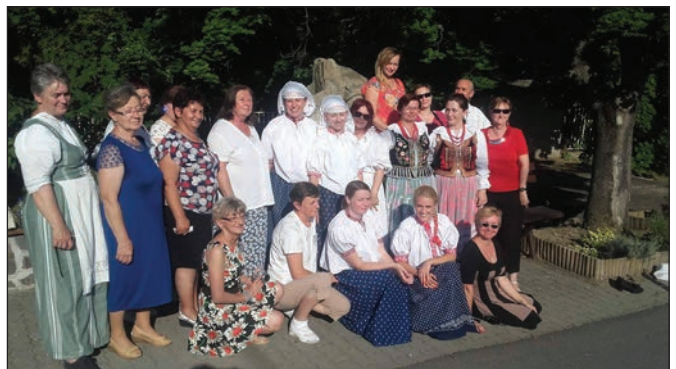
Spotkanie w Kozardzie 2017