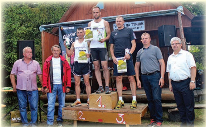
Podium klasyfikacji generalnej mężczyzn