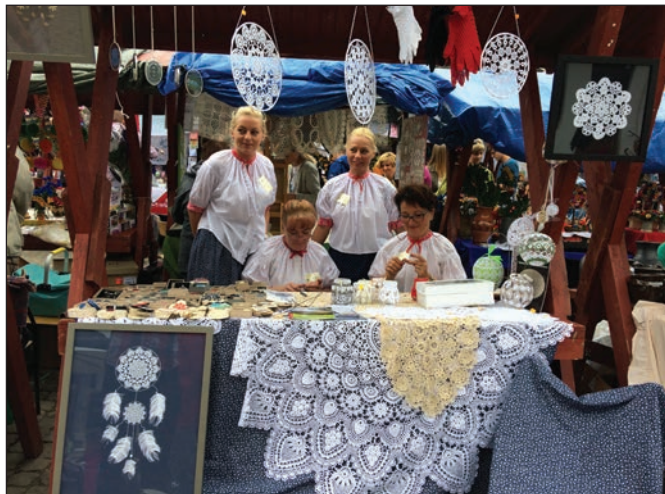
Koniakowianki w Kazimierzu nad Wisłą