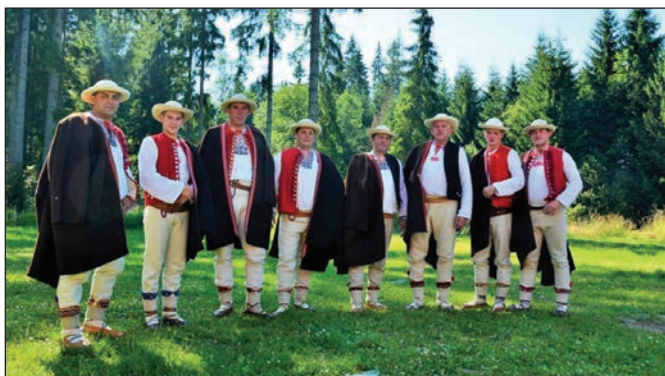
Leszczynianie z Leszczyny

Po raz kolejny mamy potwierdzenie czarno na białym, że Trójwieś Beskidzka jest ostoją folkloru muzycznego. W dniach 29 lipca - 1 sierpnia 2017 roku w ramach 48. Festiwalu Folkloru Górali Polskich w Żywcu odbył się konkursu kapel, grup śpiewaczych, śpiewaków ludowych, instrumentalistów, mistrzów uczących śpiewu i gry na instrumentach. Wśród nagrodzonych miło nam przeczytać znajome nazwiska naszych muzyków.