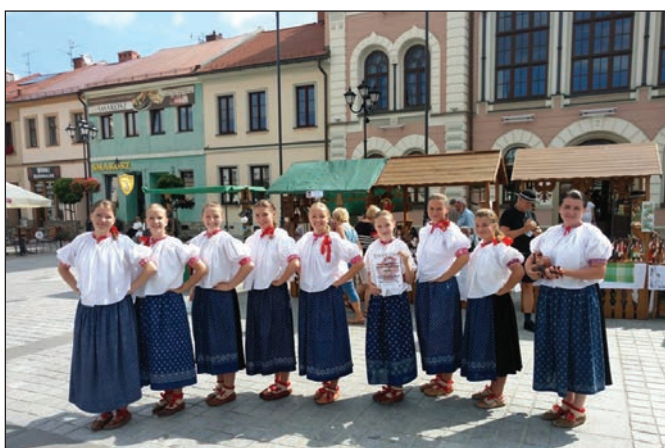
Żeńska grupa śpiewacza Istebna

II miejsce - żeńska grupa śpiewacza Istebna z Istebnej