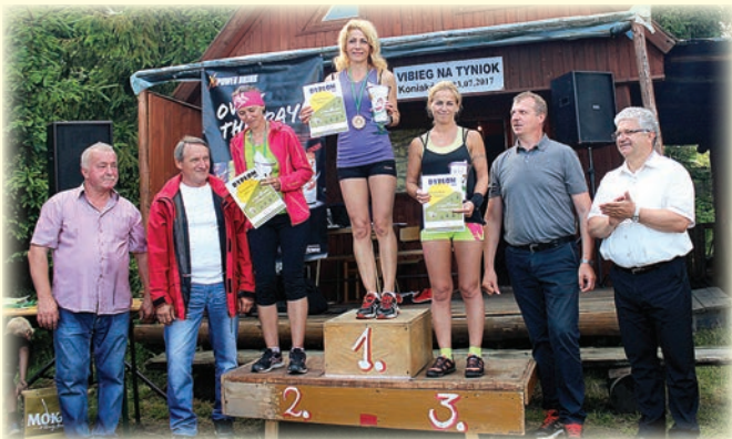
Podium klasyfikacji generalnej kobiet