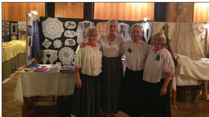
Festiwal Koronek w Vamberku

ści owocują obecnością koronczarek z Czech na tegorocznych Dniach Koronki.