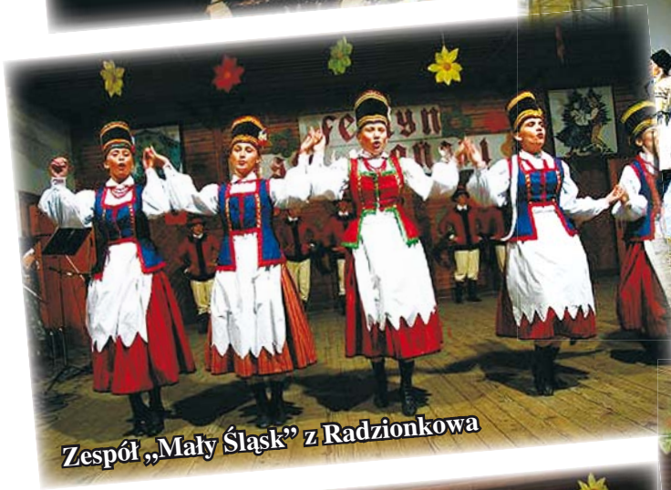
Zespół „Mały Śląsk” z Radzionkowa