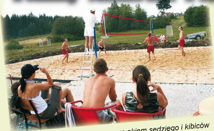
Rywalizacja na piasku pod baczynym okiem sędziego i kibiców