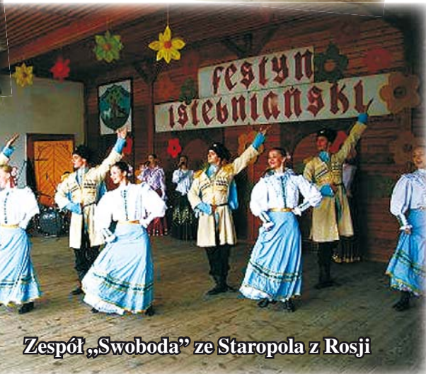
Zespół „Swoboda” ze Staropola z Rosji