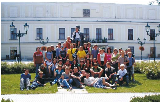
Uczestnicy międzynarodowego obozu.