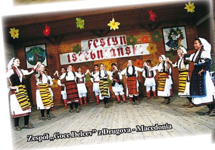
Zespół „Goce Delcey” z Drugova - Macedonia