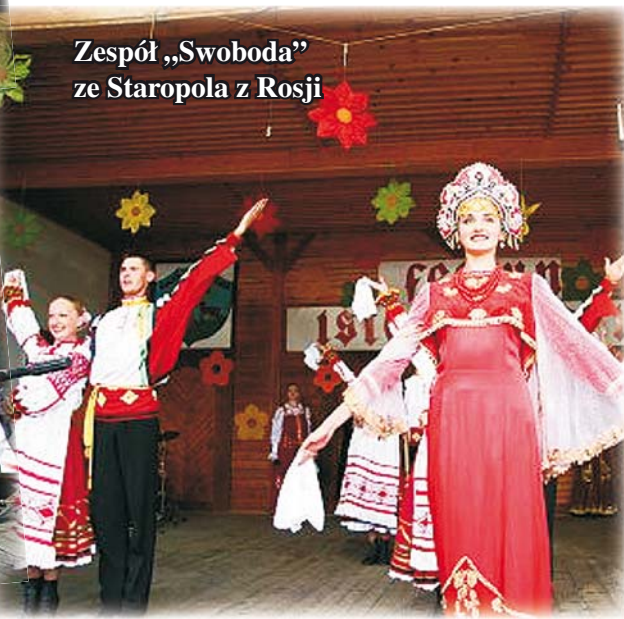
Zespół „Swoboda” ze Staropola z Rosji