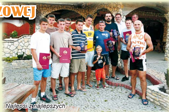
Najlepsi z najlepszych