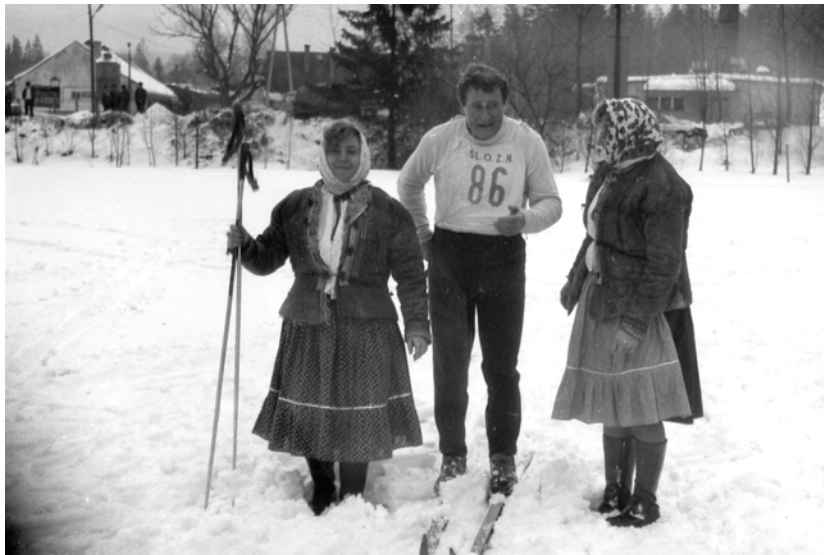
po „robocie” na nartach nabiera sił