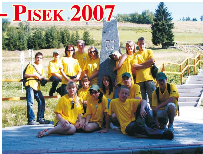
Młodzież z Istebnej podczas wycieczki na Trójstyk