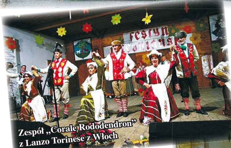
Zespół „Corale Rododendron” z Lanzo Torinese z Włoch