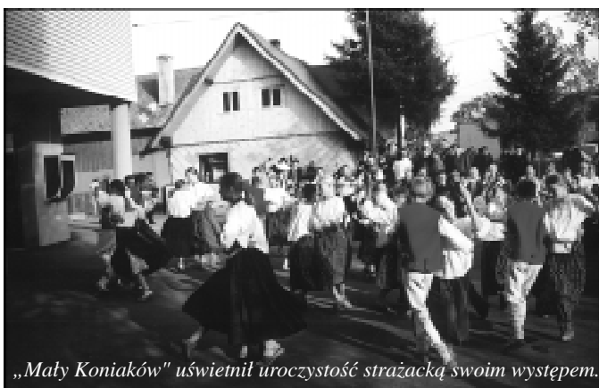
„Mały Koniaków” uświetnił uroczystość strażacką swoim występem.