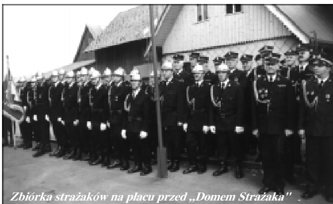
Zbiórka strażaków na placu przed „Domem Strażaka”