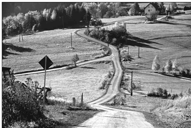
Droga na Tyniok

20 października br. dokonano odbioru końcowego robót budowlanych wykonywanych w ramach projektu „Przebudowa drogi gminnej nr 615 055 S na Tyniok oraz remont drogi powiatowej nr 1450 S Kamesznica – Koniaków” będącego efektem współpracy Gminy Istebna z Powiatem Cieszyńskim. Projekt ostatecznie uzyskał dofinansowanie z budżetu państwa w ramach Narodowego Programu Przebudowy Dróg Lokalnych – Etap II Bezpieczeństwo – Rozwój w kwocie 494.747 zł i nie więcej niż 50% wartości kosztów kwalifikowanych.