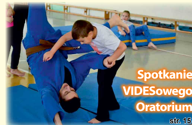
Spotkanie VIDEOSOWEGO Oratorium