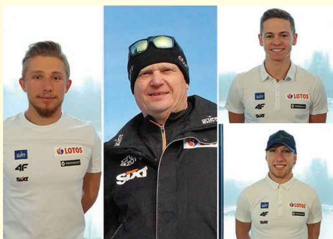
Nasi kadrowicze i trener Kadry A