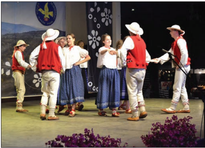
Występy podczas TKB