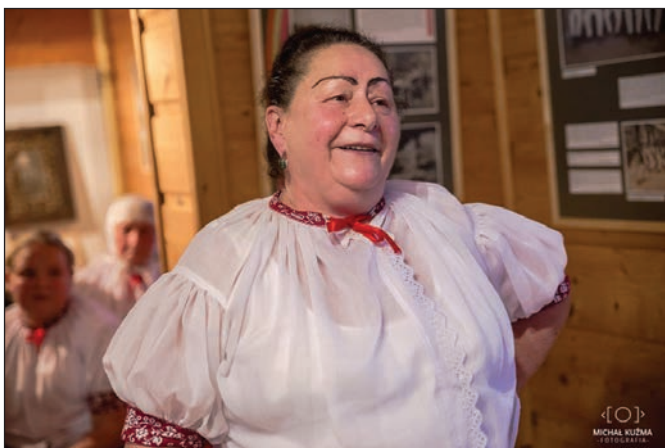
fol. M. Kuźma

Jury Konkursu pogratulowało wysokiego poziomu wystąpień, bardzo licznego udziału w konkursie oraz estetyki w postaci strojów regionalnych. Wśród nielicznych uwag jury zwróciło uwagę na pojawiające się tzw. „estradowe” śpiewanie, które nie jest tradycyjną formą śpiewu w Beskidzie Śląskim. Podkreślono także, aby pilnować odpowiedniego do wieku repertuaru.