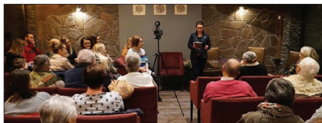
fol. J. Michałek

W dniu 18 listopada odbyło się spotkanie promocyjne publikacji w Hotelu Złoty Groń w Istebnej. Spotkanie było jednocześnie podsumowaniem projektu, który realizowało Stowarzyszenie Kulturalno-Oświatowe „Na Groniach” w ramach programu dotacyjnego NIEPODLEGŁA, pt. Przy granicy - Niepodległa widziana z perspektywy pogranicza - świat mikrohistorii . Wyjątkowi byli i goście – na spotkanie przybyły