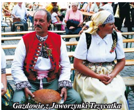
Gazdowie z Jaworzynki Trzycatka