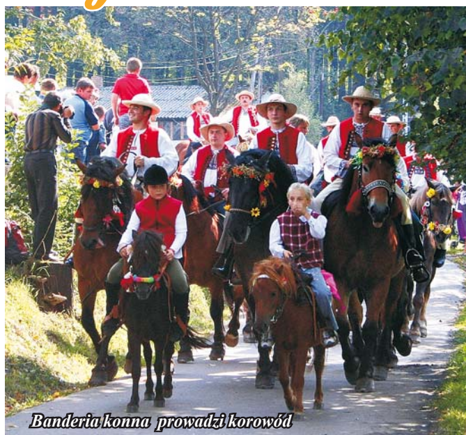
Bandieria konna prowadzi korowód