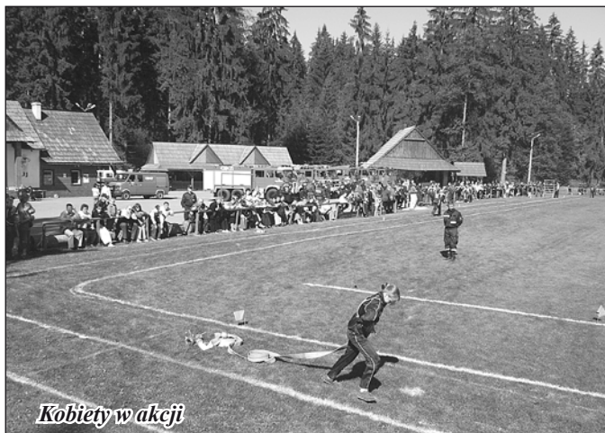
Kobiety w akcji