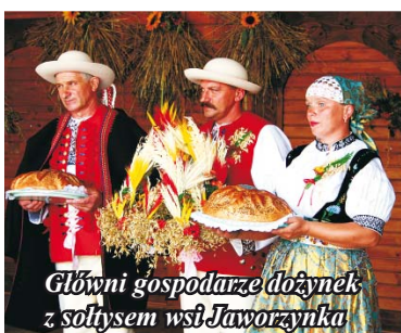
Główni gospodarze dożynek z sołtysem wsi Jaworzynka