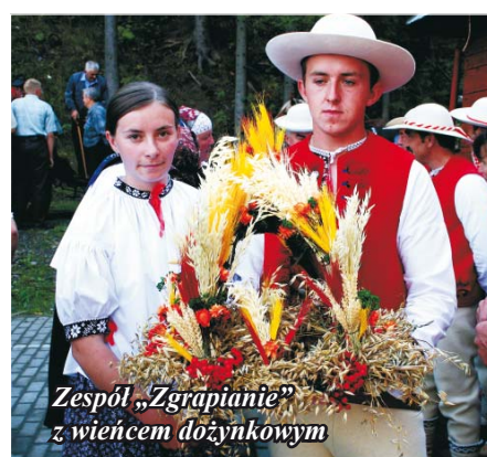
Zespół „Zgrapianie” z wieńcem dożynkowym