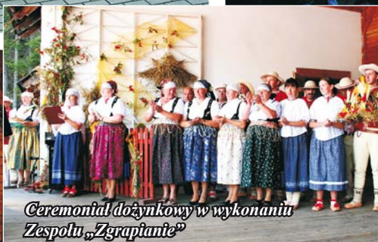
Ceremoniał dożynkowy w wykonaniu Zespołu „Zgrapianie”