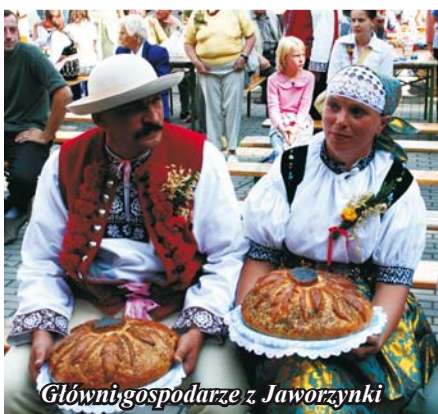
Główni gospodarze z Jaworzynki