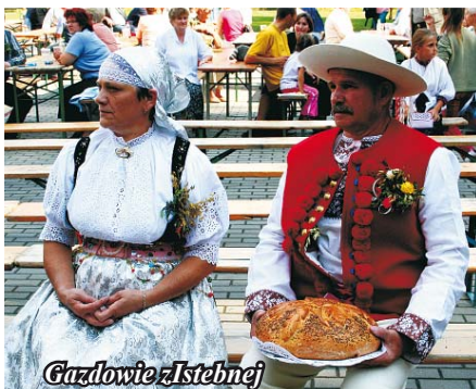
Gazdowie z Istebnej