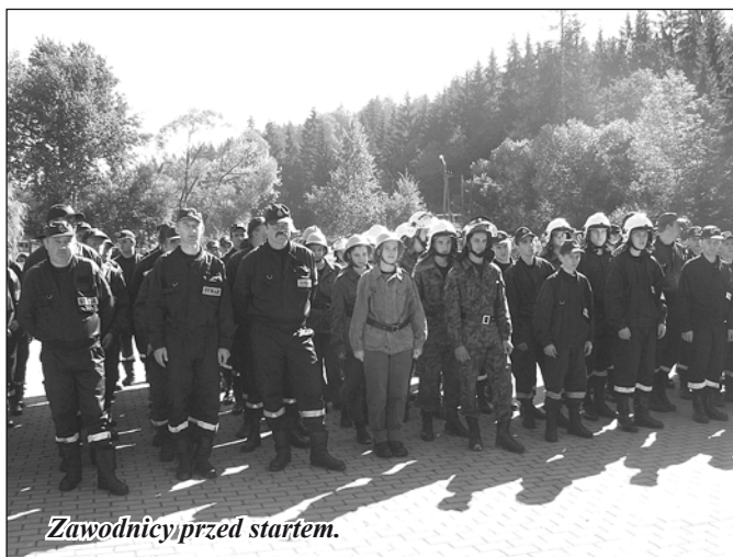
Zawodnicy przed startem.