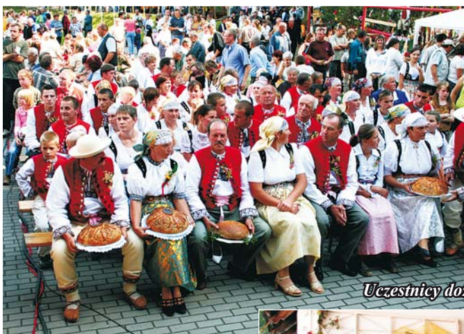
Uczestnicy dożynek w strojach regionalnych