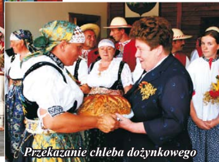
Przekazanie chleba dożynkowego