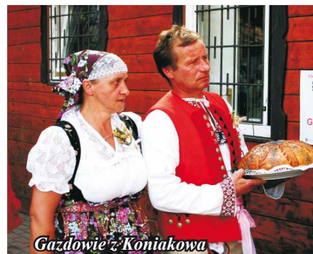
Gazdowie z Koniakowa