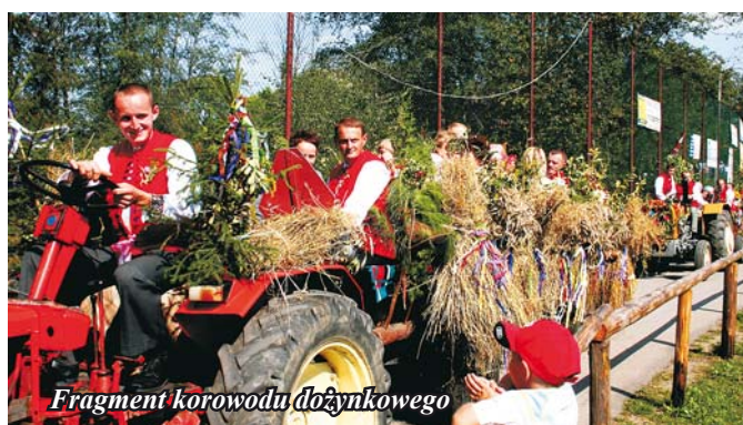
Fragment korowodu dożynkowego