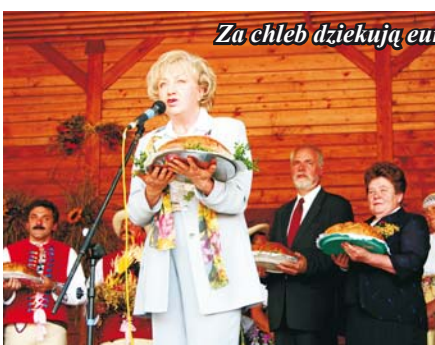
Za chleb dziękują eurodeputowani