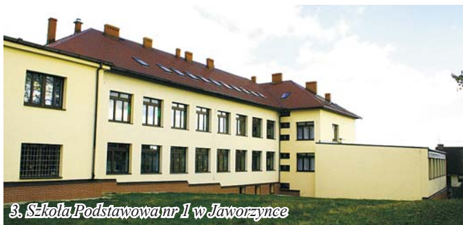
3. Szkoła Podstawowa nr 1 w Jaworzynce