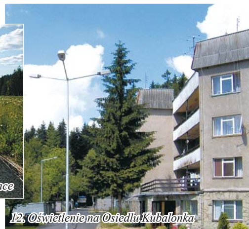
12. Oświetlenie na Osiedlu Kubalonka