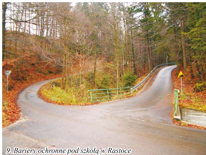
9. Bariery ochronne pod szkołą w Rastocu