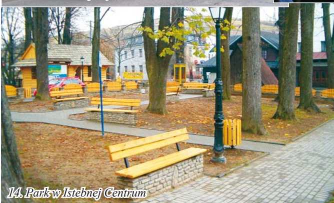
14. Park w Istebnej Centrum