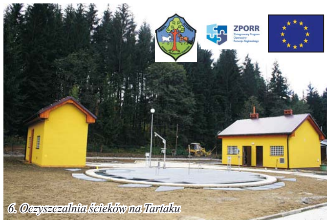
6. Oczyszczalnia ścieków na Tartaku