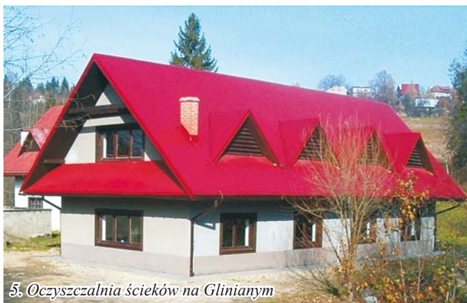
5. Oczyszczalnia ścieków na Glinianym