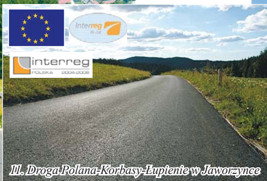
11. Droga Polana-Korbasy-Lupienie w Jaworzynie