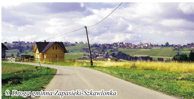
8. Droga gminna Zapasieki-Szkawlonka