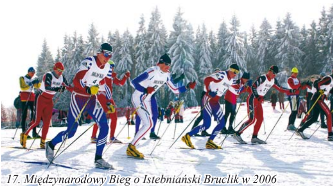
17. Międzynarodowy Bieg o Istebniański Bruclik w 2006