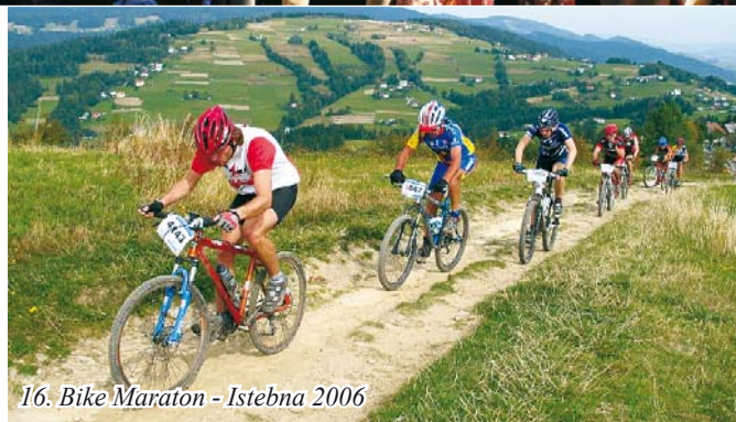
16. Bike Maraton - Istebna 2006