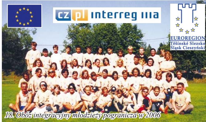
18. Obóz integracyjny młodzieży pogranicza w 2006

„Nasza Trójwiesi” - wydaje URZĄD GMINY w Istebnej Adres: 43-470 ISTEbNA 1000, tel. 033 85-56-087 - woj. śląskie Adres strony internetowej Gminy Istebna: www.ug.istebna.pl , adres poczty elektronicznej Urzędu Gminy: urząd.gminy@ug.istebna.pl Redaguje Zespół w składzie: Krystyna Rucka, Teresa Łaszewska, Janusz Waszut oraz Jacek Kohut (GCI).