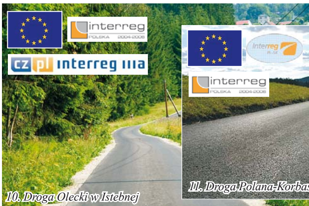
10. Droga Olecki w Istebnej