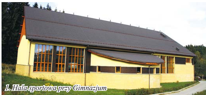
1. Hala sportowa przy Gimnazjum