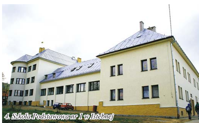
4. Szkoła Podstawowa nr 1 w Istebnej