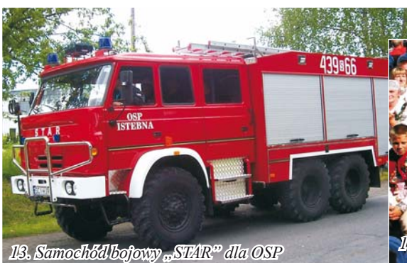
13. Samochód bojowy „STAR” dla OSP