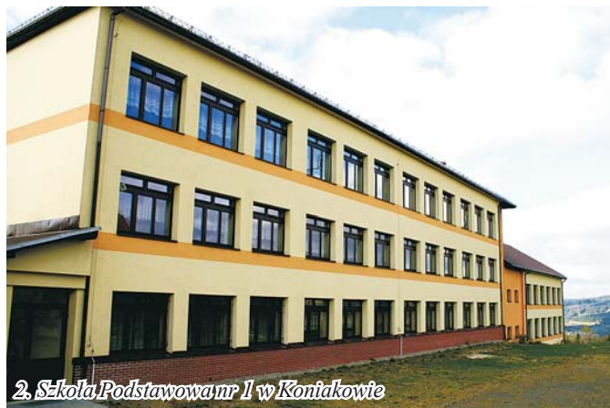
2. Szkoła Podstawowa nr 1 w Koniakowie