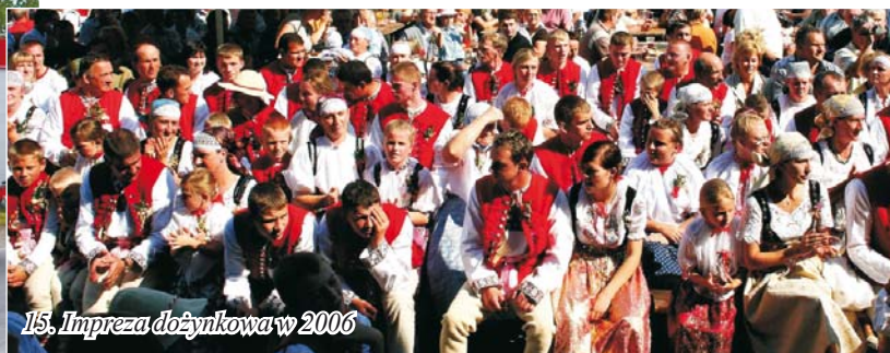
15. Impreza dożynkowa w 2006