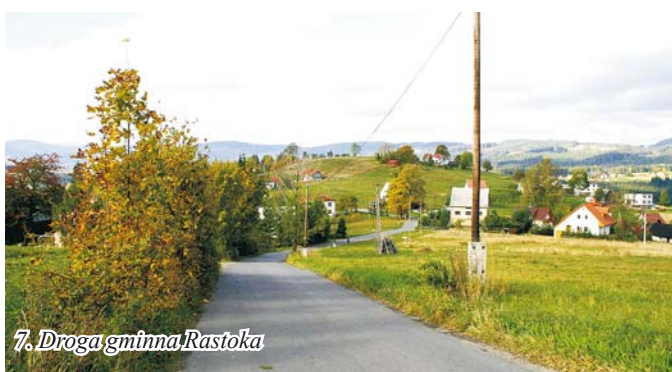
7. Droga gminna Rastoka