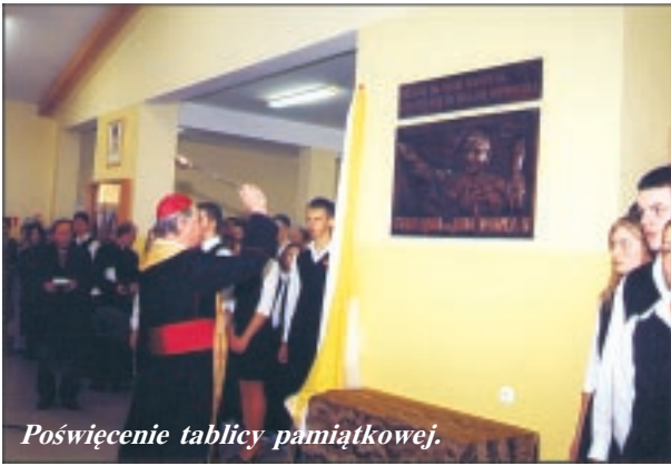
Poświęcenie tablicy pamiątkowej.