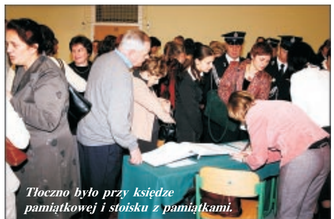
Tłoczno było przy księdze pamiątkowej i stoisku z pamiątkami.

„Nasza Trójmieść” - wydaje URZĄD GMINY w Istebnej Adres: 43-470 ISTEbNA 1000, tel.85-56-087 - woj. śląskie Adres strony internetowej Gminy Istebna: www.ug.istebna.pl , adres poczty elektronicznej Urzędu Gminy: urząd.gminy@ug.istebna.pl Redaguje Zespół w składzie: Krystyna Rucka, Teresa Łaszewska, Janusz Waszut oraz Jacek Kohut (GCI).