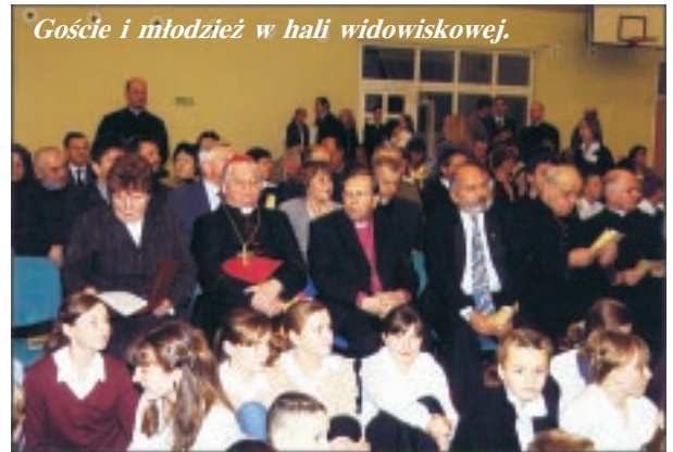
Goście i młodzież w hali widowiskowej.