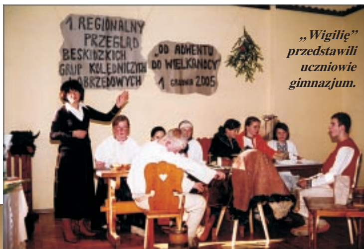
„Wigilię” przedstawił uczniowie gimnazjum.