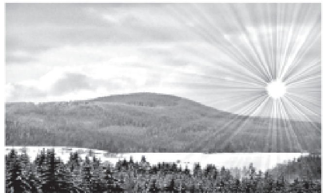
Słonecznikowego Nowego Polka (Kościół Górali)

I Zgromadzenie Górali Śląskich Związku Podhalan miało uroczysty charakter. Było okazją do nawiązania znajomości i przyjaźni. Mamy nadzieję, że następne spotkania będą coraz licz-