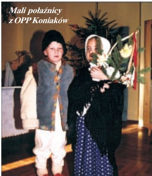
Mali połaźnicy z OPP Koniaków