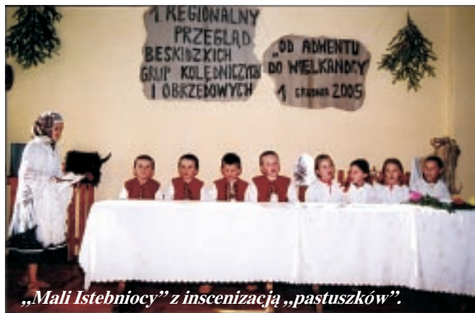
„Mali Istebniocy” z inscenizacją „pastuszków”.