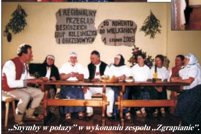
„Snybmy w połaży” w wykonaniu zespołu „Zgrapanie”.