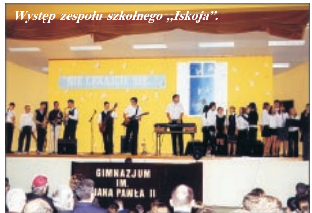
Występ zespołu szkolnego „Iskoja”.