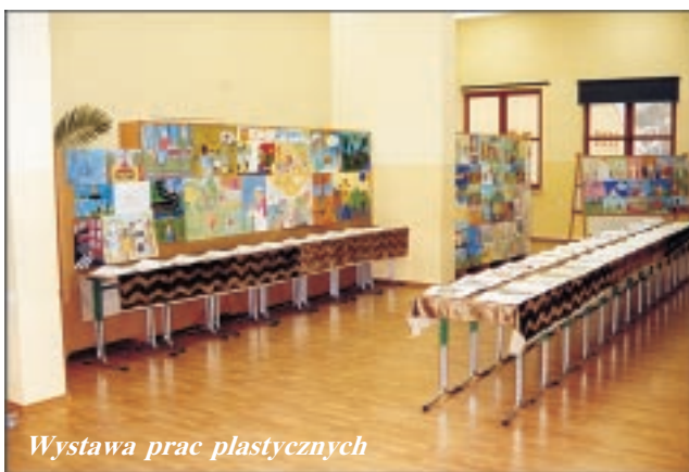
Wystawa prac plastycznych