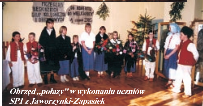
Obrzęd „połaży” w wykonaniu uczniów SP1 z Jaworzynki-Zapasek