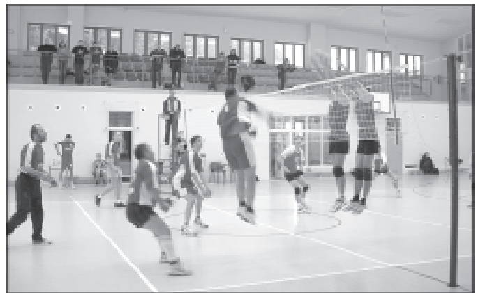
Fragment meczu finałowego - atakuje Istebna