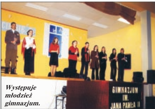
Występuje młodzież gimnazjum.