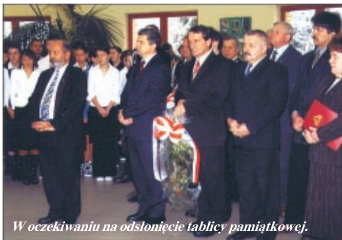
W oczekiwaniu na odsłonięcie tablicy pamiątkowej.