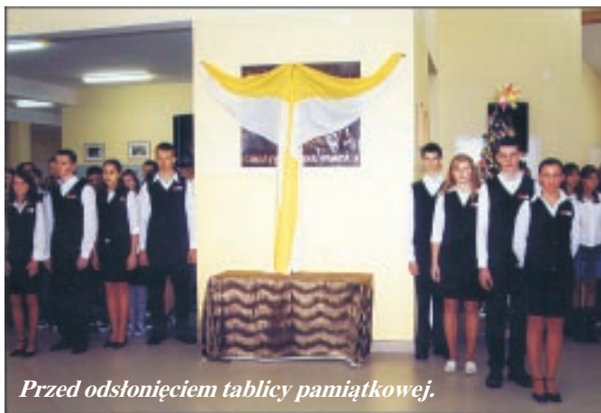
Przed odsłonięciem tablicy pamiątkowej.