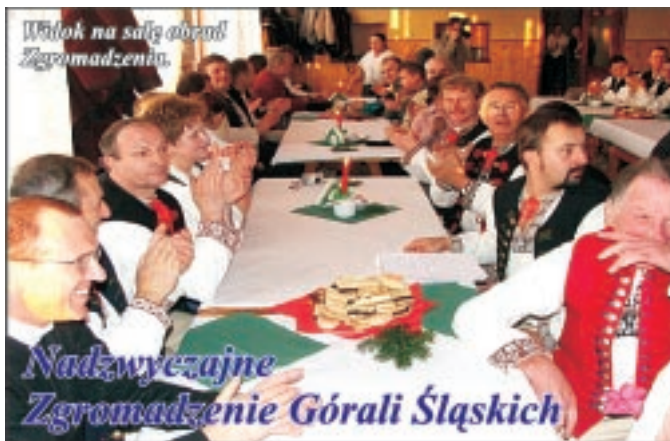
Witok na sali obrad Zgromadzenia.