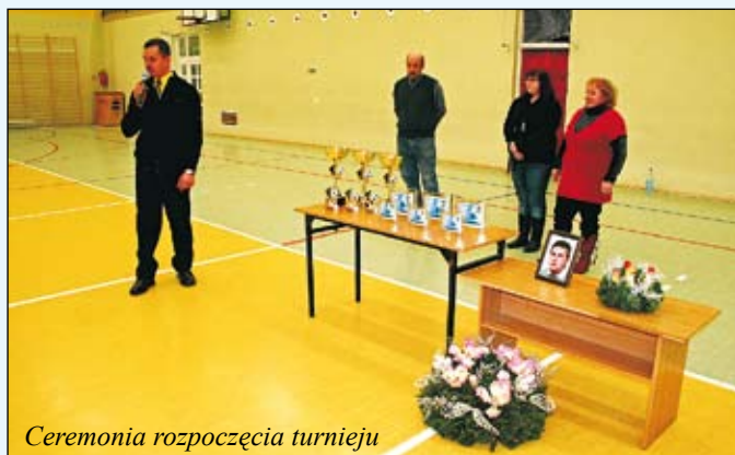
Ceremonia rozpoczęcia turnieju