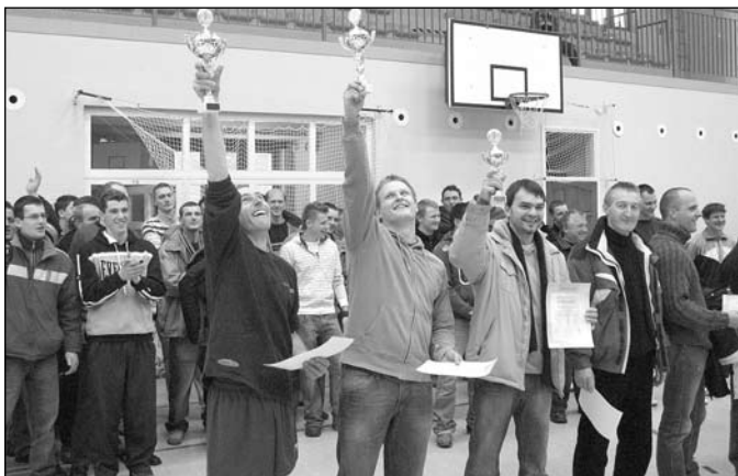
Kapitanowie III pierwszych drużyn z pucharami