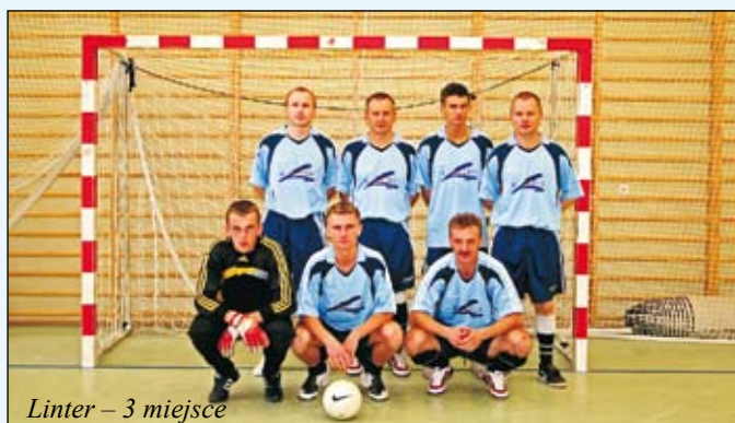
Linter – 3 miejsce