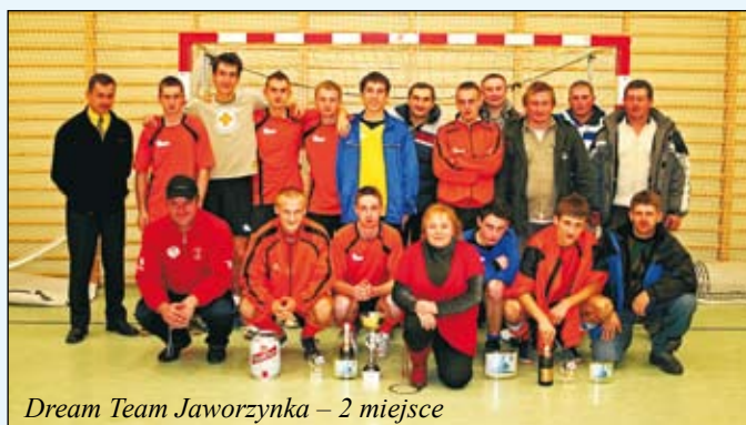
Dream Team Jaworzynka – 2 miejsce