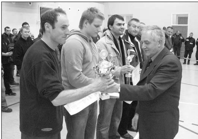
Prezes Zarządu Powiatowego wręcza puchar kapitanowi drużyny