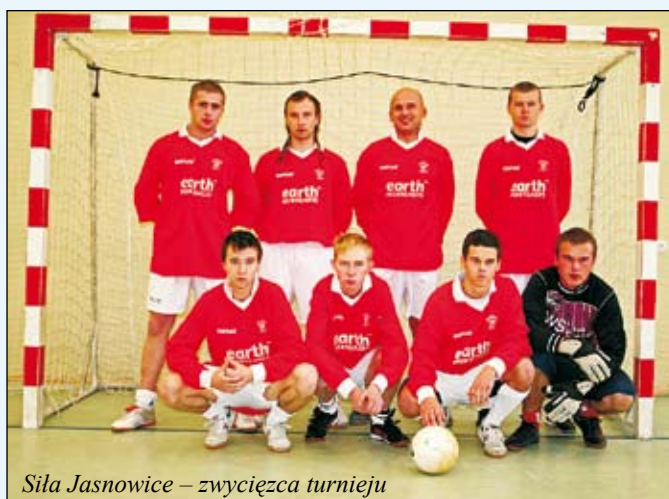
Siła Jasnówice – zwycięzca turnieju