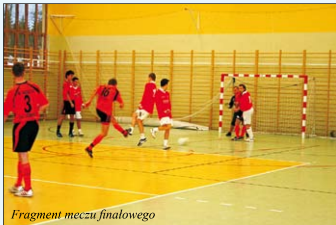
Fragment meczu finałowego