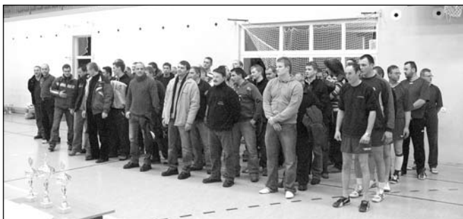
Zbiórka drużyn po zakończeniu turnieju