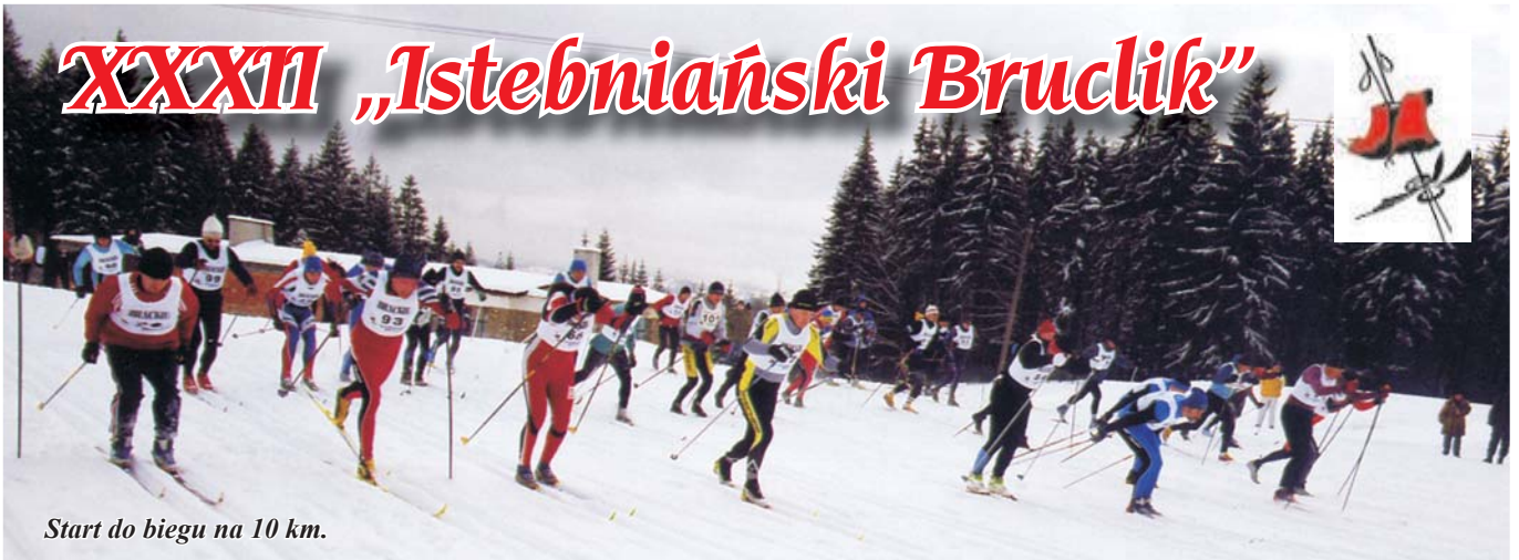
Start do biegu na 10 km.