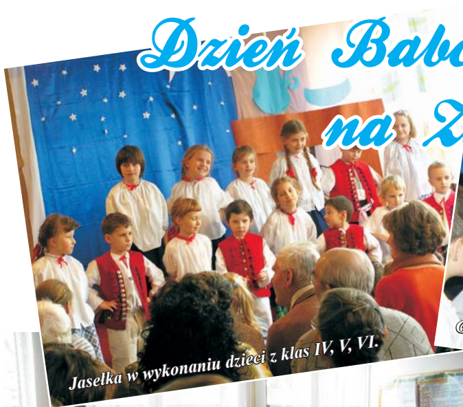
Jasełka w wykonaniu dzieci z klas IV, V, VI.