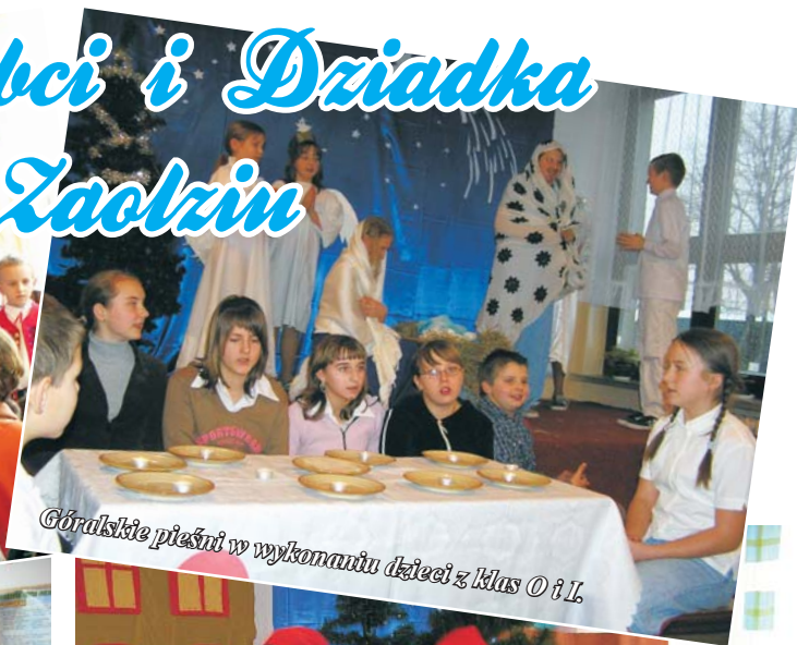
Góralskie pieśni w wykonaniu dzieci z klas 0 i I.