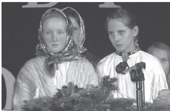
Połaźnicy z Jaworzynki

W dniach 19-20 stycznia w Miejskim Domu Kultury w Żywcu miał miejsce Przegląd Zespołów Kolędniczych i Obrzędowych Żywieckie Gody.