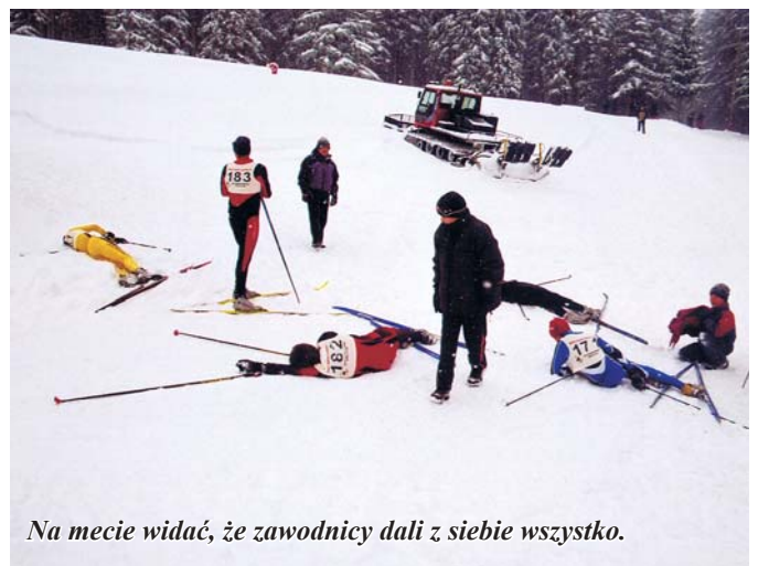
Na mecie widać, że zawodnicy dali z siebie wszystko.