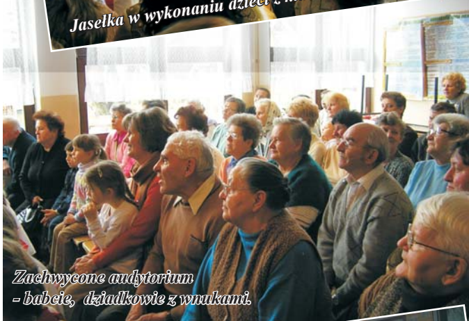
Zachwycone audytorium - babcie, dziadkowie z wnucami.