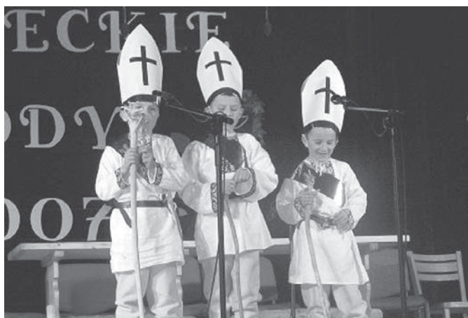
Pastuszkowie z Istebnej

Jest to prezentacja grup i zespołów, które kultywują ludowe obrzędy i tradycje związane z okresem od początku grudnia poprzez Święta Bożego Narodzenia, zwyczaje Nowego Roku do końca Mięsozostu, Przegląd Zespołów Kolędniczych i Obrzędowych Żywieckie Gody należy do najbardziej widowiskowych a zarazem niezwykle ważnych imprez folklorystycznych województwa śląskiego.