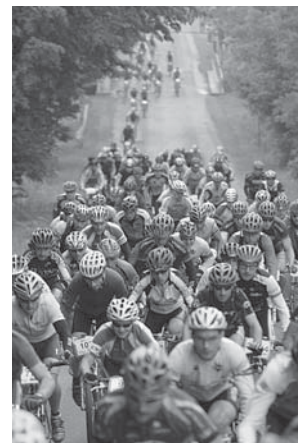
Maratony rowerowe stały się skutecznym narzędziem promocji gminy.