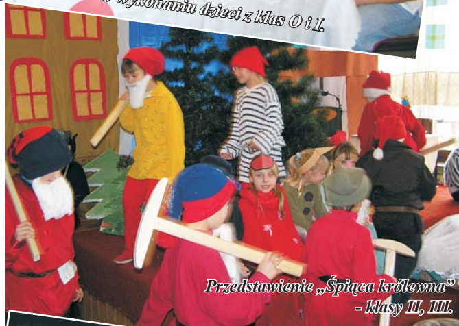
Przedstawienie „Śpiąca królewna” - klasy III, IIII.