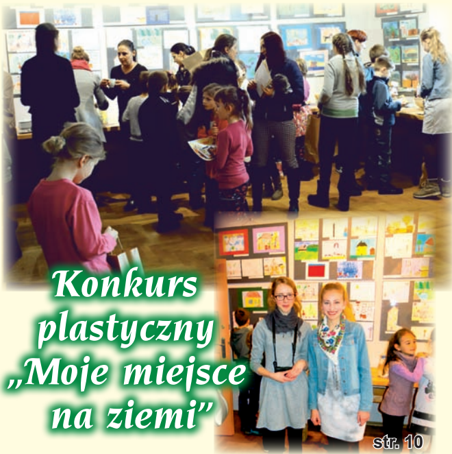
Konkurs plastyczny „Moje miejsce na ziemi”