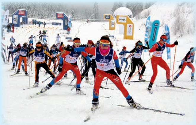
Start kategorii Juniorka C w biegu techniką dowolną ze startu wspólnego zawodów na Kubalonce