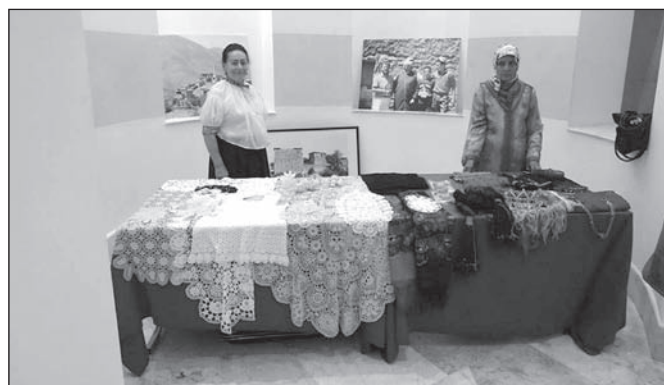
Z koronkami w Maroku