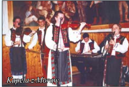
Kapela z Moraw