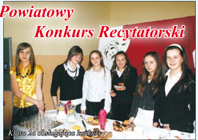
Klasa 2a obsługująca konkurs