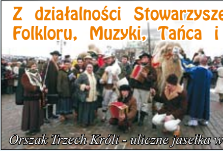
Orszak Trzech Króli - uliczne jasełka w Warszawie