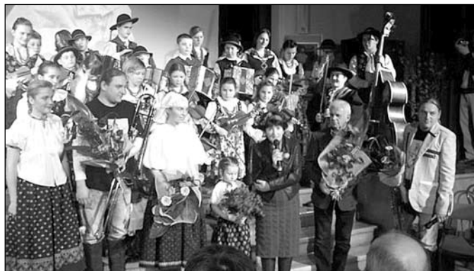
Promocja albumu w Domu Narodowym w Cieszynie