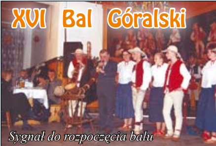
Sygnal do rozpoczęcia balu