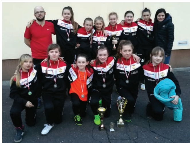
SP 1 Koniaków

Największą sensacją turnieju było zdobycie drugiego miejsca przez dziewczęta reprezentujące SP 1 w Koniakowie. Drużyna ta składała się bowiem głównie z dziewcząt z roczników 2004-2008 podczas gdy reszta ekip reprezentowana była w większości przez dziewczyny z rocznika 2002.