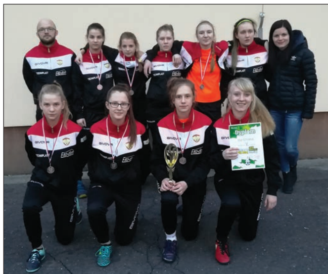
ZSP w Istebnej