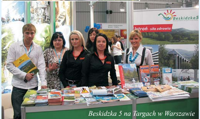
Beskidzka 5 na Targach w Warszawie