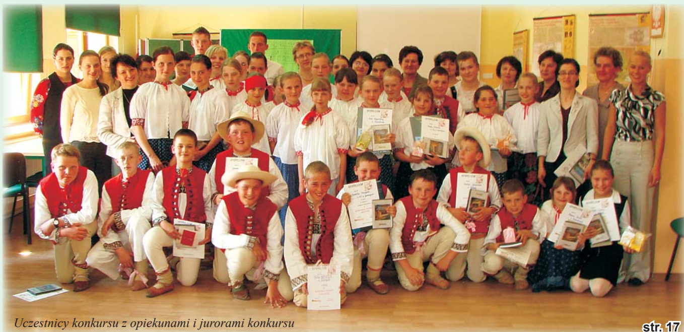
Uczestnicy konkursu z opiekunami i jurorami konkursu