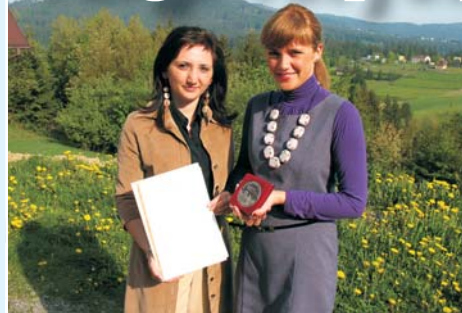
Medal z Targów Gdańskich