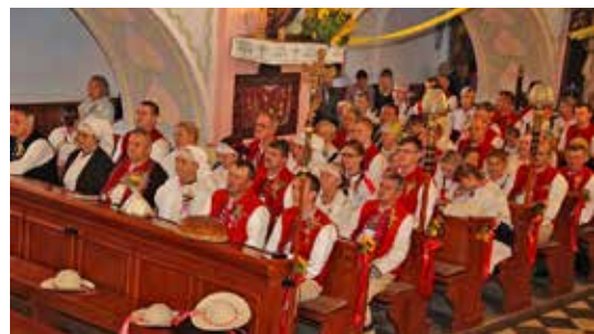
Dożynki parafialne, rok 2015