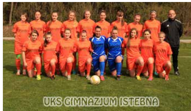
Piłkarki UKS Gimnazjum Istebna przed – nierozegranym – meczem z MKS Żory

W dalszym ciągu natomiast rozgrywa swoje mecze ligowe drużyna młodzików młodszych tego klubu.