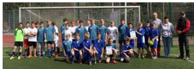
Uczestnicy Gminnego Turnieju Piłki Nożnej Szkół Podstawowych