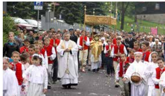
Procesja Bożego Ciała, rok 2013