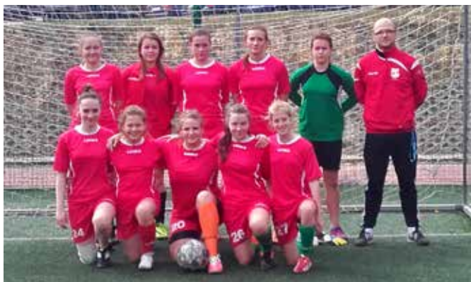
Drużyna dziewcząt Gimnazjum Istebna

Gimnazjum Istebna – Gimnazjum Publiczne Juszczyna 1:0