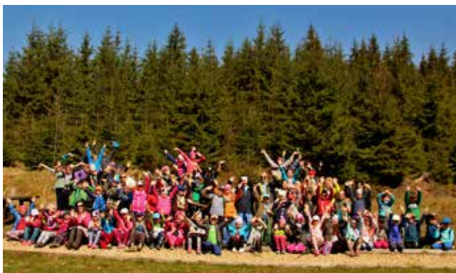
Dzień Ziemi 22 kwietnia w SP 1 w Koniakowie

W Światowym Dniu Ziemi odbyło się w naszej gminie tradycyjne Sprzątanie Świata, w którym wzięły udział dzieci szkolne i przedszkolne wraz z nauczycielami i opiekunami.