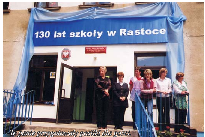
Te panie przygotowały posiłki dla gości.