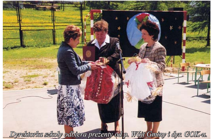
Dyrektorka szkoły odbiera prezenty od p. Wójta Gminy i dyr. GOK-u.