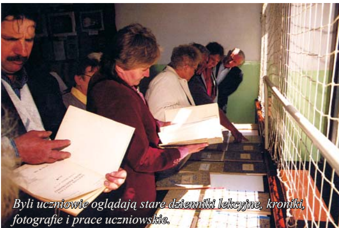
Byli uczniowie oglądają stare dzienniki lekcyjne, kroniki, fotografie i prace uczniowskie.