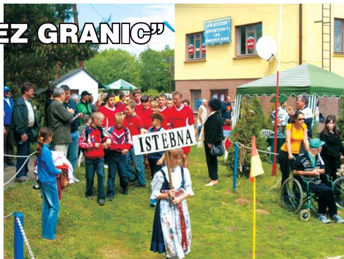
Reprezentacja Gminy Istebna w przemarszu do prezentacji.