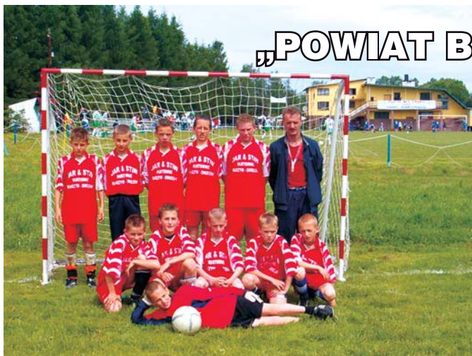
Drużyna SP nr 1 Koniaków zwycięży turnieju mini piłki nożnej.