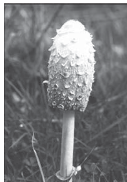
Czernidlak kołpakowaty, często spotykany w naszym regionie.

Czernidlaki należą do grzybów jadalnych, lecz ich smak nie jest specjalnie dobry. Poza tym według niektórych znawców grzybów czernidlak połączony z alkoholem powoduje zatrucia. Zatem nie zbierajmy czernidlaków, a o wiele więcej korzyści przyniesie nam obserwowanie rozwoju tych oryginalnych grzybów.