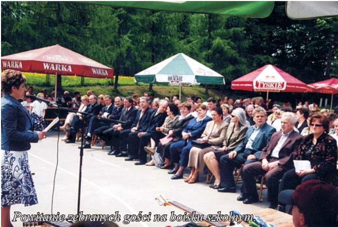
Powitanie zebranych gości na boisku szkolnym.