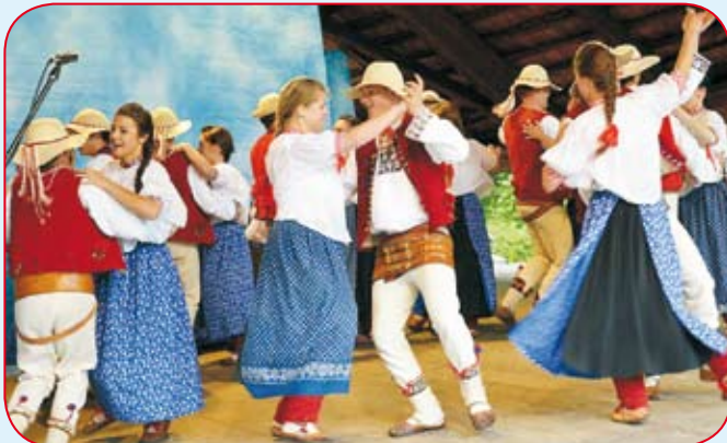
Zespół „Koniaków” podczas WICI w Chorzowie