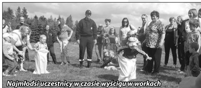
Najmłodsi uczestnicy w czasie wyścigu w workach