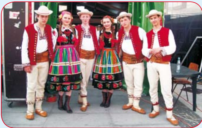
Chłopcy z Zespołu „Koniaków” z tancerkami z Łowicza