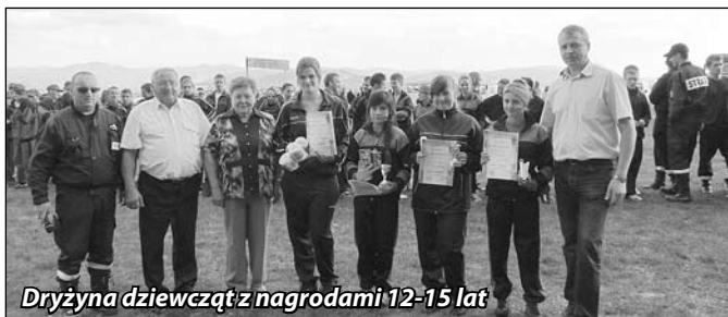
Dryżyna dziewcząt z nagrodami 12-15 lat