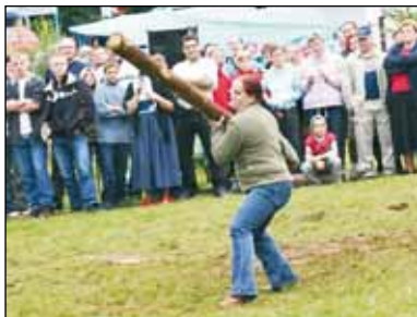
Jo wóm pokorzym chłopiska jako sie mo chybać!