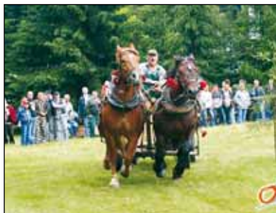
Wio a wio kónički.