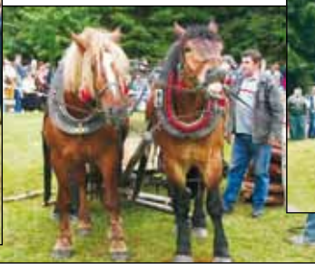
Kón by sie uśmiol.