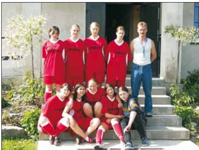
Reprezentacja Gimnazjum Istebna.