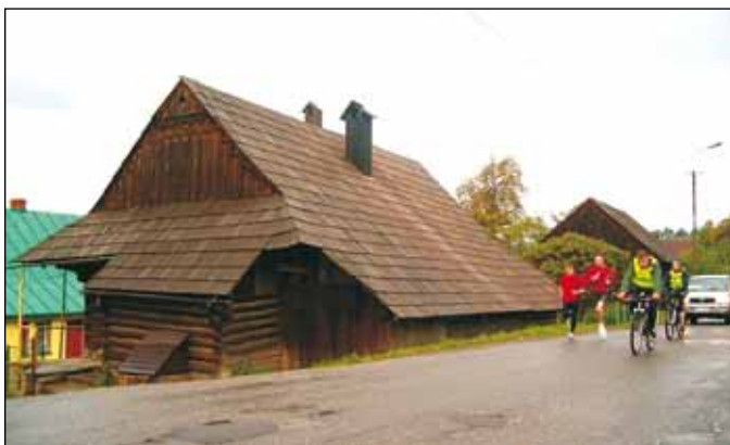
Uczestnicy na trasie.