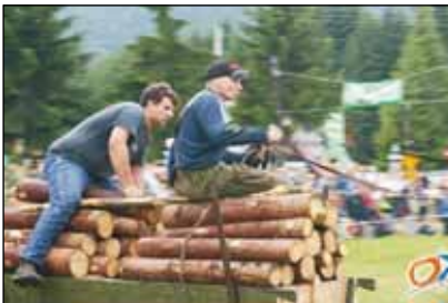
Ale je śwóng.