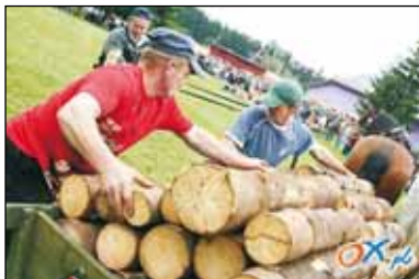
Roz dwa chłopi, roz dwa.