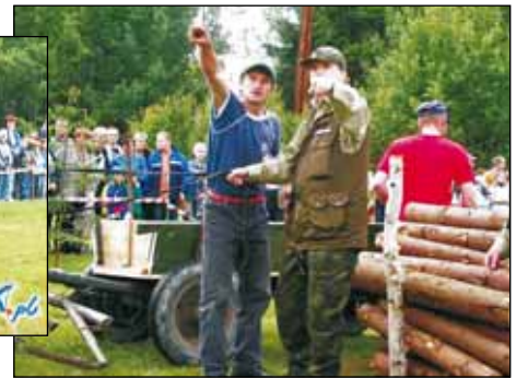
Janko dziwej sie jako moś jechać – Tam?... Ja tam.