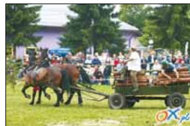
Ujcu pomali bo sie mi to wykulo.