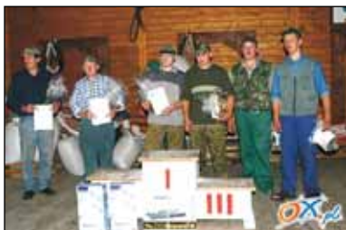
Zwyciynscy w slalómie z papiyrówkóm.