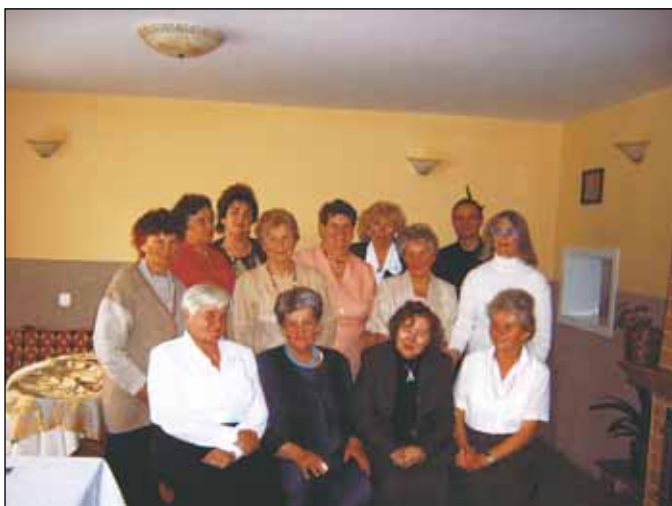
Uczestniczki spotkania koleżeńskiego.