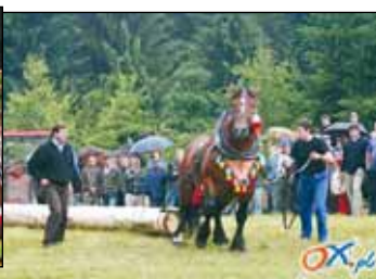
Gniady jak zesiliś tós wieciór ci domy łowska.