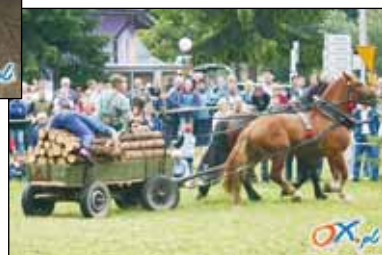
Marek borok przy gupocie by zleciol.