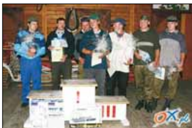
W Slalómie z trómym pyrsi miysce było egzekwo.