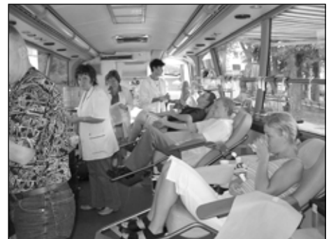
3. ... wreszcie igła i ... po sprawie.