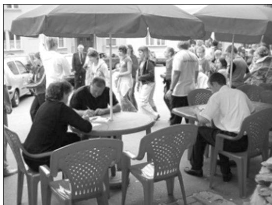
1. Najpierw rejestracja ...

36 osób oddało krew w akcji honorowego krwiodawstwa przeprowadzonej w niedzielę 2 lipca w Istebnej przez Regionalne Centrum Krwiodawstwa