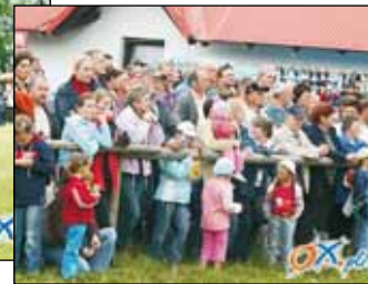
Kibice też dopisali.