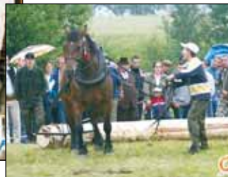
No jo uś ci nie pó mógym.