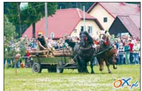
Pacholcy łód Susiek to faworycy w slalómie z drzewym – przedbiygli loców.