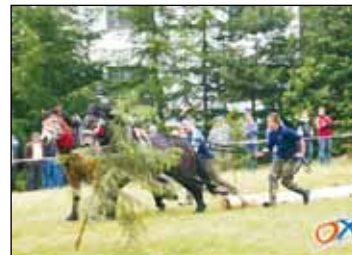
Gniady bo jak cie pacnym...