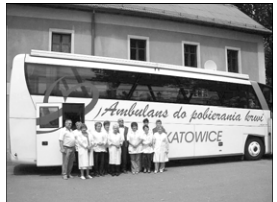
J. Kohut 4. Organizatorzy akcji w komplecie.