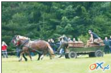
Tómo nie uwierziś jako sie mi tu fajnie siedzi.