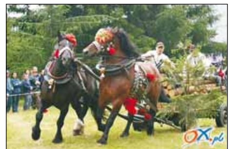
Dochylejcie sie dochylejcie, no tak.