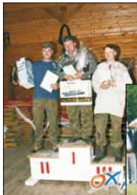
Faworyci w Sile ucióngu.