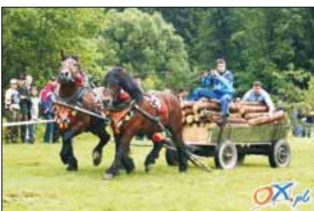
Łogierzy z Kóniokowa Pustek ze swojimi furma-nami.