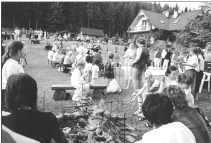
Uczestnicy imprezy plenerowej.

okazją do degustacji regionalnych przysmaków, które zapewniły gospodarstwa agroturystyczne. Piękna pogoda i urok miejsca sprzyjały zabawie, która trwała do późna.