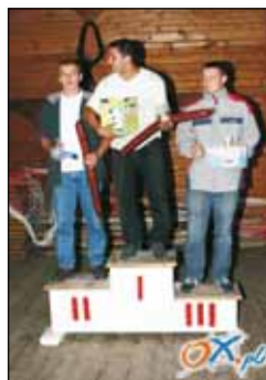
Za tóm kielbasym wortalo chybać kulkym.