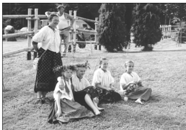
Dziewczyny z zespołu z wionkami na głowie.

Tegoroczne spotkanie plenerowe w Jaworzynce – w dolinie Krężelki odbywało się pod nazwą „Góralskie obrzędy nocy św. Jana”. Zaprezentowane przez zespoły regionalne „Zgrapianie” i „Mali Zgrapianie” z Jaworzynki oraz kapelę „Mała Jetelinka” z Jaworzynki i kapelę z Ogniska Pracy Pozaszkolnej w Koniakowie wspomniane wyżej zwyczaje pozwoliły przybliżyć oraz przy-