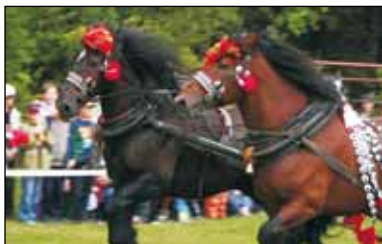
Kónie idóm leb w leb.