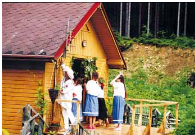
Dzieci z zespołu mojóm domy i zagrody .

Dzień świętego Jana, tj. 24 czerwca jest w tradycji słowiańskiej czasem szczególnym. Obrzęd ów wywodzi się jeszcze z tradycji prasłowiańskiej, pogańskiej, z odległych czasów przedchrześcijańskich, kiedy na słowiańskim Olimpie niepodzielnie panowali Światowit i Perun. Wraz z nastaniem chrześcijaństwa bóstwa te popadły w niepamięć, lecz wszelkiego rodzaju święta pozostały, choć zmieniły swoje oblicze i znaczenie, dopasowano je niejako do wymogów nowej religii.