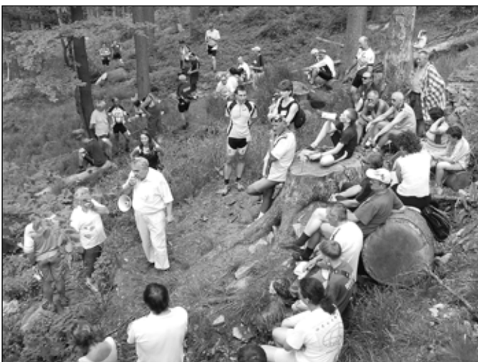
Wspólne posiady uczestników Rajdu.