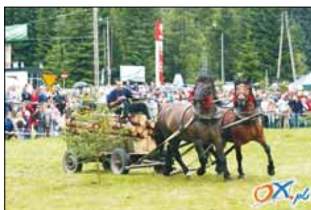
Maciek i Gniady majóm dobrego pogónicia.