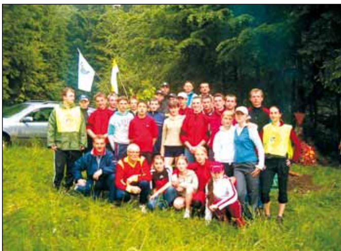
Nasi uczestnicy po przekazaniu sztafety Gminie Milówka.