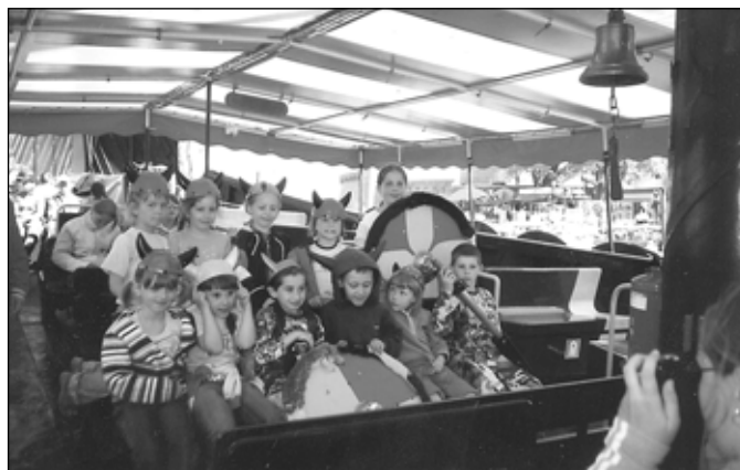
Rejs statkiem „Wiking”.

wie poznali trochę historii tego miasta i Ustroni Morskich. Pani przewodnik ukazała nam też przepiękną gotycką katedrę z XV w., rynek z budynkami pochodzącymi także z tego okresu oraz późniejsze pomniki upamiętniające Zjazd w Gnieźnie i Zaślubiny z Morzem. Na koniec wyczekiwany rejs statkiem „Wiking”, który zabrał nas na morze i do basenu portowego. Młodszy uczniowie śledzili rejs i podziwiali rekwizyty Wikingów, a starsi bacznie obserwowali statki marynarki wojennej, które pięknie prezentowały się na przystani.