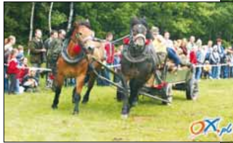
Tak rób cobyś nie spod.