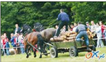
Doćkejcie kónički aś tata wyndóm.