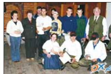
Furmanio dostali po miysku łowska dlo kóni i pamióntkowym zwónećku.