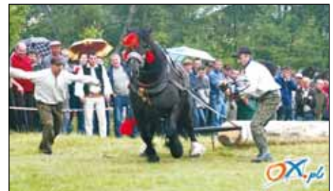
Karuś przidej, przidej.