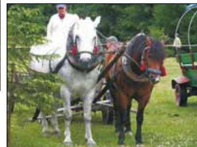
Janko z Bukowiny i siwek sóm jako bracio.