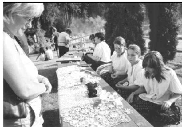
Twórcy i instruktorzy z OPP Koniakowa.

Wielką atrakcją stanowiło ponadto stawianie moja, tzn. wysokiej żerdzi zakończonej drzewkiem przystrojonym kolorowymi bibułami. Moje stawiano przed domami imienników św. Jana.