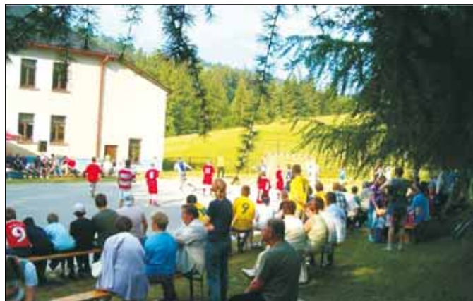
Piękna pogoda sprawiła, że impreza była bardzo udana.

Po południu na boisku szkolnym zmagania piłkarzy obserwowało wielu kibiców, którzy wieczorem bawili się przy muzyce ze-