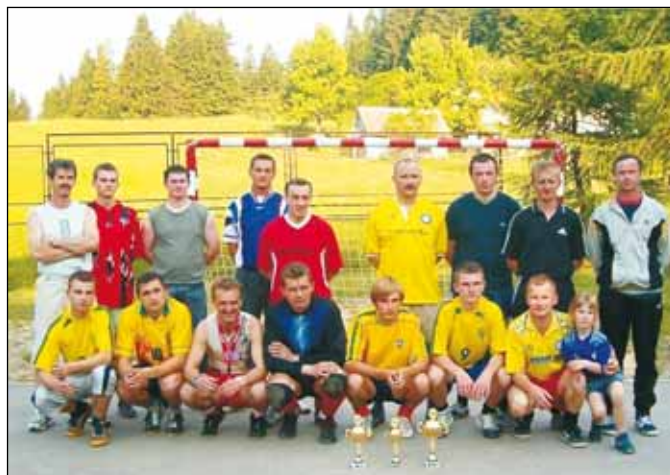
Uczestnicy turnieju piłkarskiego.