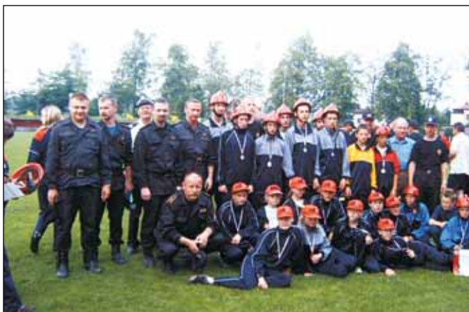
Młodzieżowe drużyny dziewcząt i chłopców z OSP Koniaków Centrum po zawodach wraz z opiekunami i sędziami.