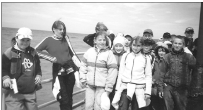
Na molo w Ustroniach Morskich.

Krótki tor przeszkód, wypicie mikstury, pocałowanie Neptuna w rękę usmarowaną pastą do zębów i złożenie przysięgi wymagało