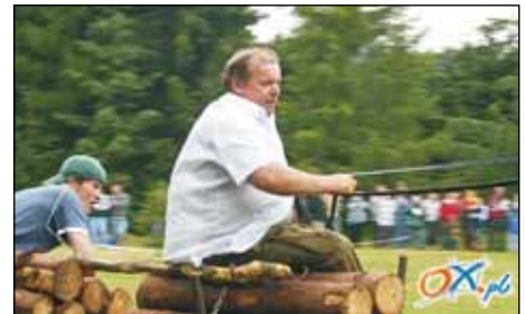
Ujec Kubica majóm nejlepsigo kónička w sile ucióngu.