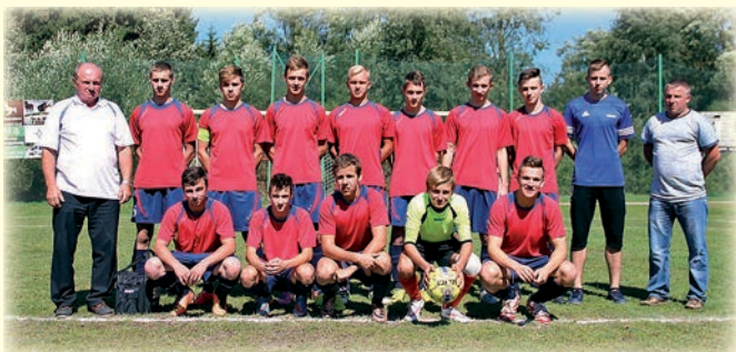
KP Trójwieś - juniorzy