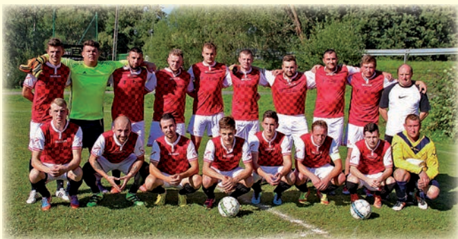
KP Trójwieś - seniorzy