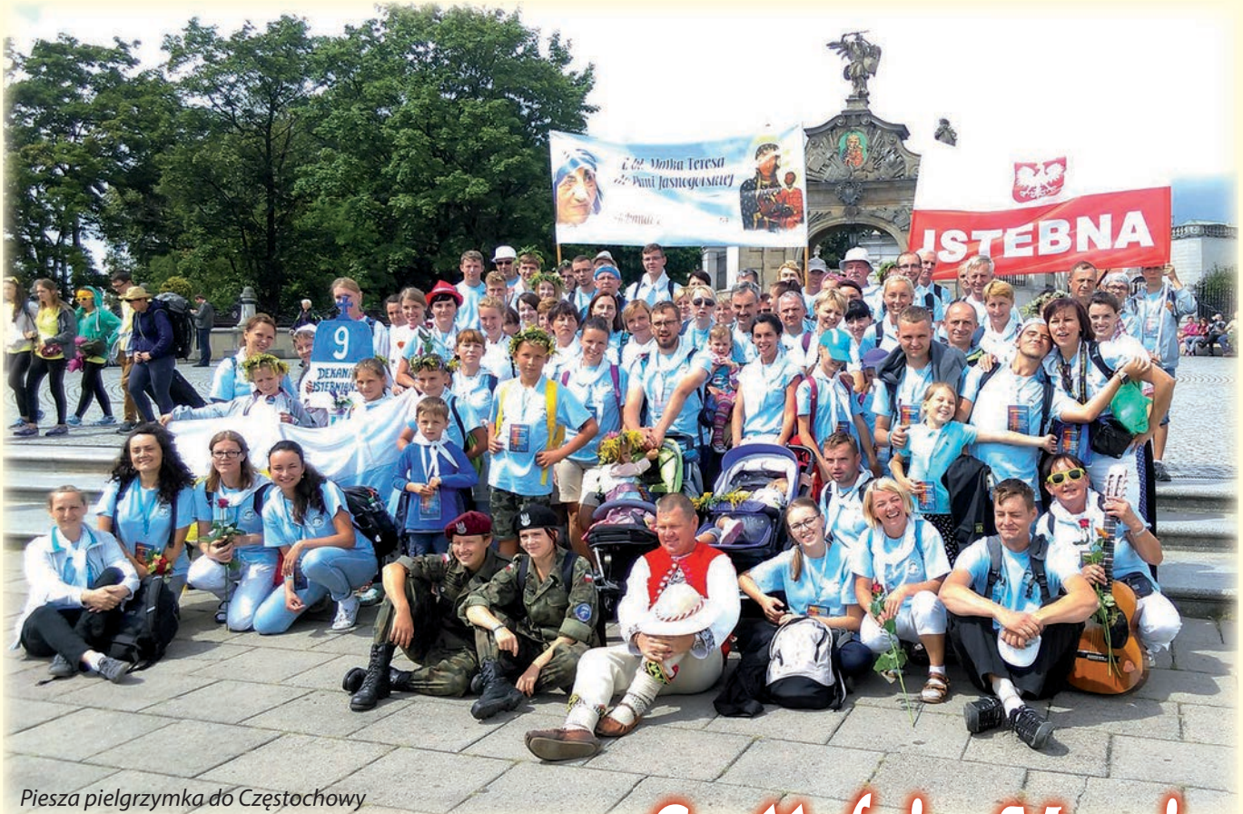
Piesza pielgrzymka do Częstochowy