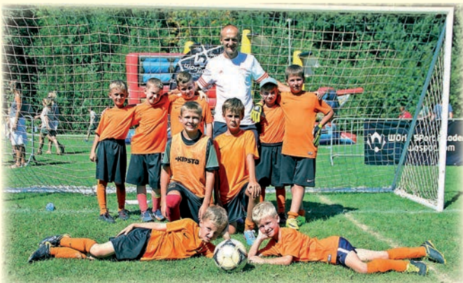
APN Góral Istebna - młodzicy 2007 i młodsi