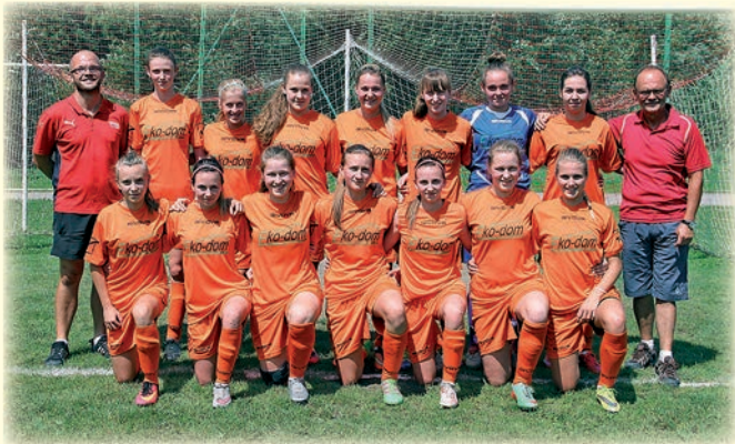
UKS Gimnazjum Istebna - kobiety