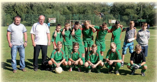
KP Trójwieś - trampkarze