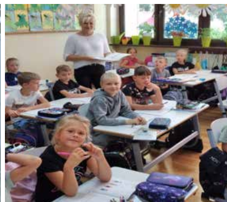
> Nowa wykładzina sala -Gminne Przedszkole