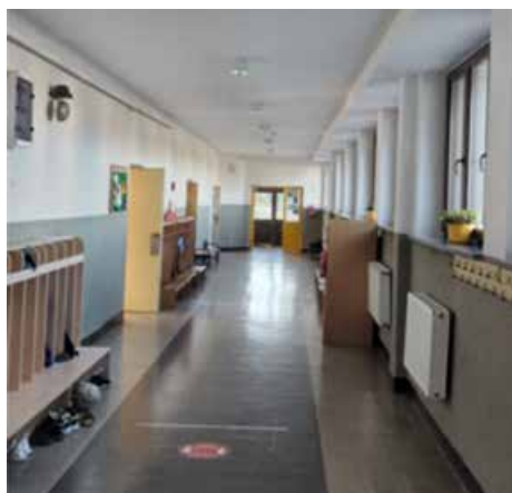
> Wyremontowany korytarz– Gminne Przedszkole