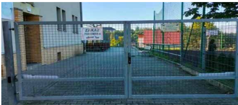
> Automatyka bramowa Gminne Przedszkole