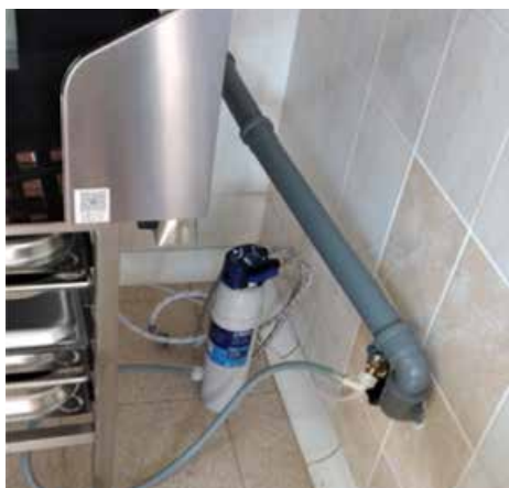
> Zawory doprowadzające wodę –Gminne Przedszkole