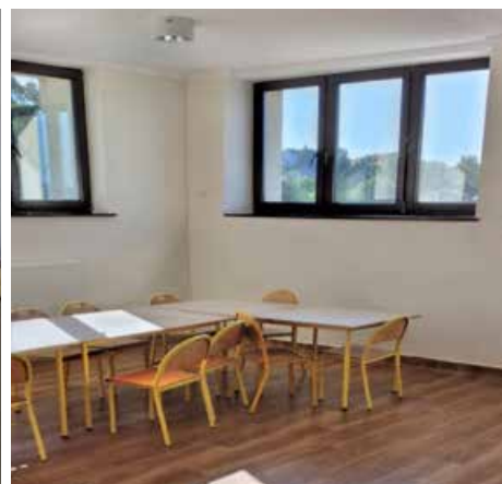
> Nowa wykładzina w świetlicy oraz odnowione ściany – Gminne Przedszkole