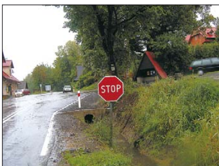
Oznakowanie od strony Jasnowic