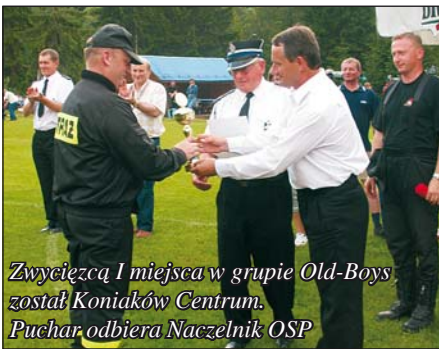
Zwycięzcą I miejsca w grupie Old-Boys został Koniaków Centrum. Puchar odbiera Naczelnik OSP