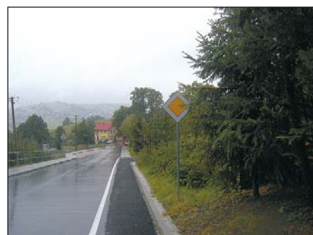
Oznakowanie od strony Jaworzynki