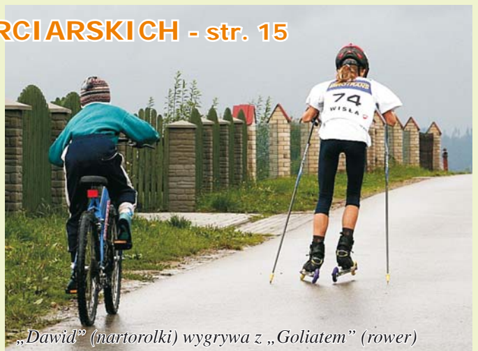
„Dawid” (nartorolki) wygrywa z „Goliatem” (rower)

„Nasza Trójmieś” - wydaje URZĄD GMINY w Istebnej Adres: 43-470 ISTEbNA 1000, tel. 033 85-56-087 - woj. śląskie Adres strony internetowej Gminy Istebna: www.ug.istebna.pl , adres poczty elektronicznej Urzędu Gminy: urząd.gminy@ug.istebna.pl