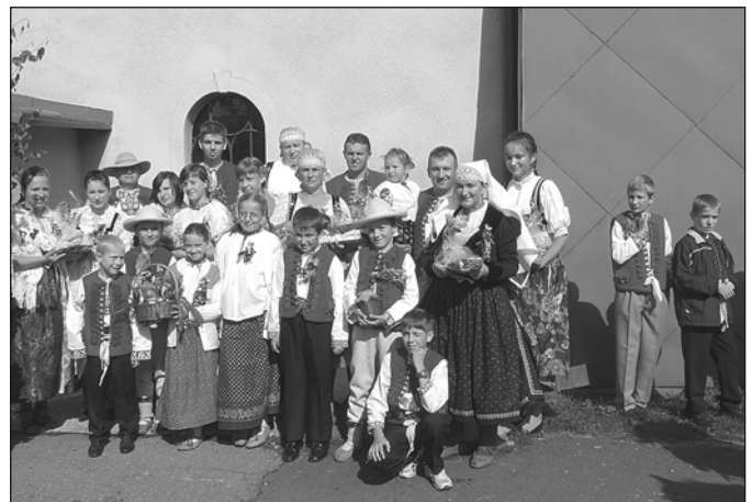
Tegoroczne dożynki z placu od Kulonka

Nadal jednak najpiękniejsze kolasy i wozy są powożone końmi I to właśnie część tej najpiękniejszej tradycji.