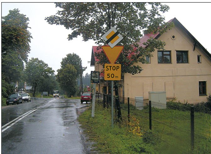
Oznakowanie od strony Koniakowa