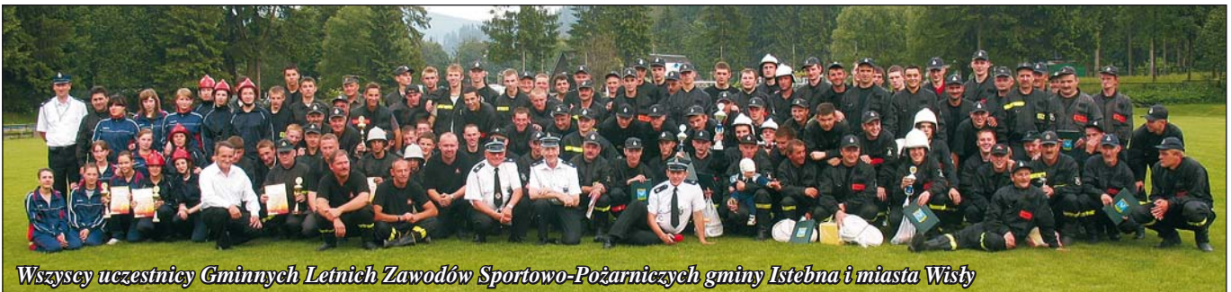
Wszyscy uczestnicy Gminnych Letnich Zawodów Sportowo-Pożarniczych gminy Istebna i miasta Wisły