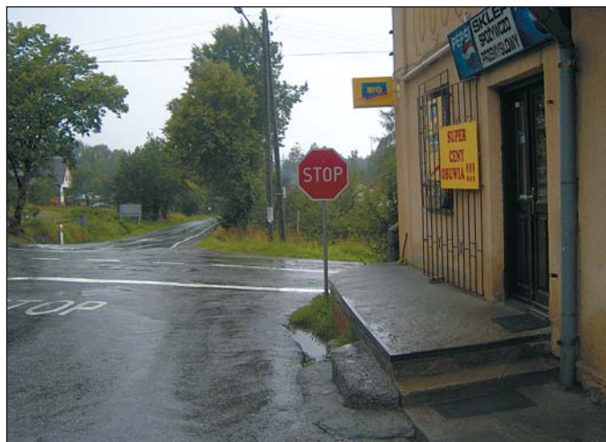
Oznakowanie od strony Koniakowa