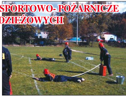
Młodzieżowa drużyna dziewcząt pokonuje jedną z konkurencji