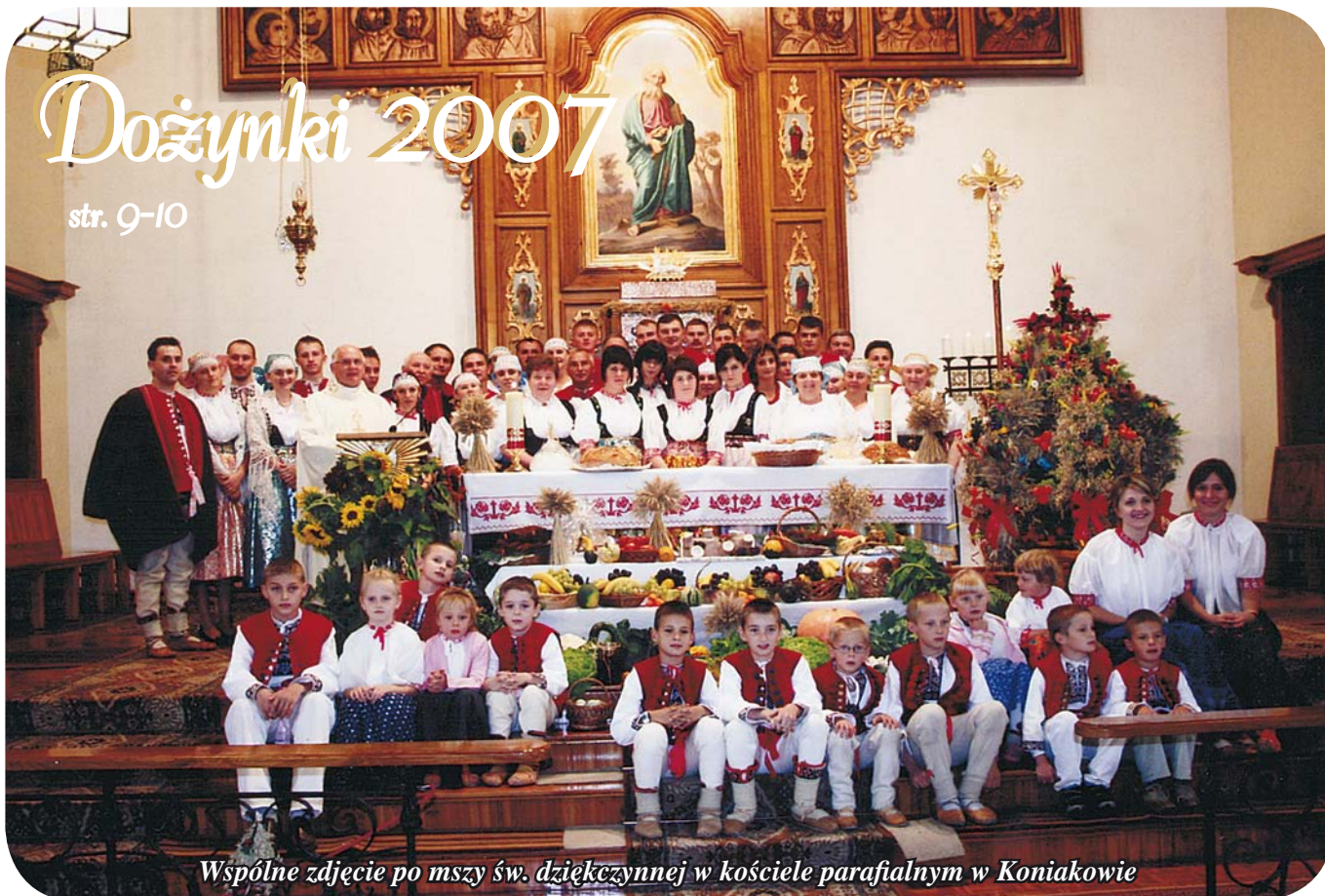
Wspólne zdjęcie po mszy św. dziękczynnej w kościele parafialnym w Koniakowie