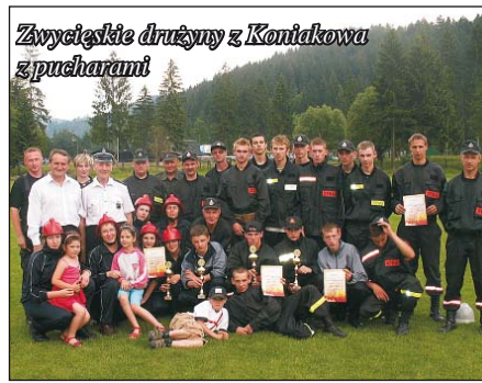
Zwycięskie drużyny z Koniakowa z pucharami