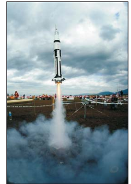
Start rakiety Saturn I B