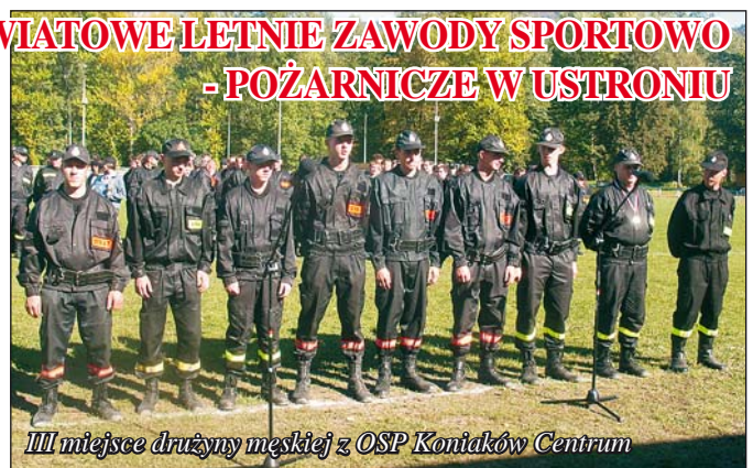
III miejsce drużyny męskiej z OSP Koniaków Centrum