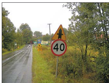
Oznakowanie od strony Istebnej