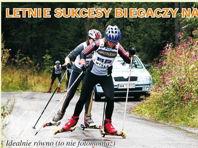
Idealnie równo (to nie fotomontaż)