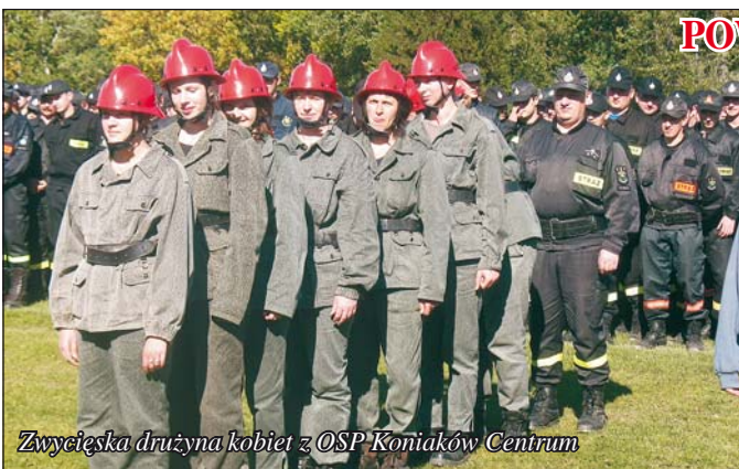
Zwycięska drużyna kobiet z OSP Koniaków Centrum