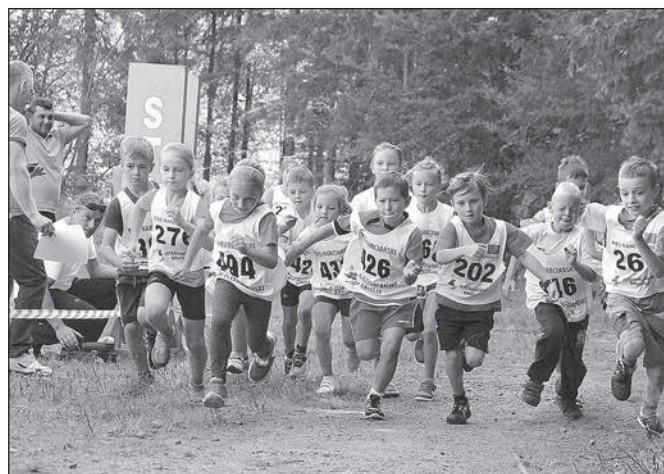
Start kategorii Klasy I-III

Biegi odbyły się na pięknie położonej trasie wzdłuż Olzy na ścieżce Edukacji Ekologicznej. Zawodnicy startowali w 6 kategoriach rocznik 2007 – 2009, 2004 – 2006 oraz 2001 – 2003. Do startu zgłosiło się około 40 zawodników i zawodniczek.