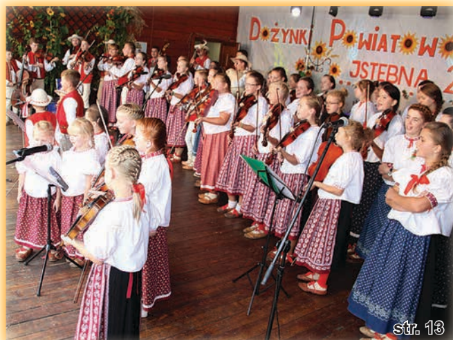
Jubileusz kapeli „Jetelinka”