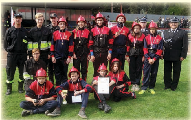
Powiatowe Zawody Sportowo-Pożarnicze MDP w Cieszynie