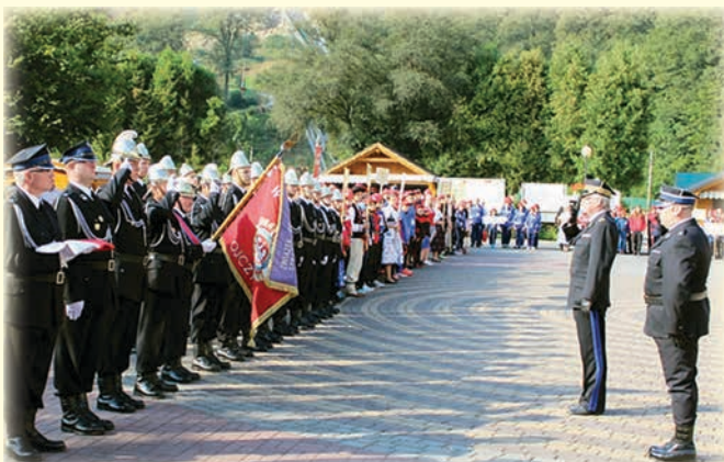
Strażacy z OSP Koniaków Centrum na zawodach Krajowych w Wiśle