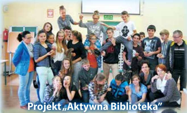
Projekt „Aktywna Biblioteka”