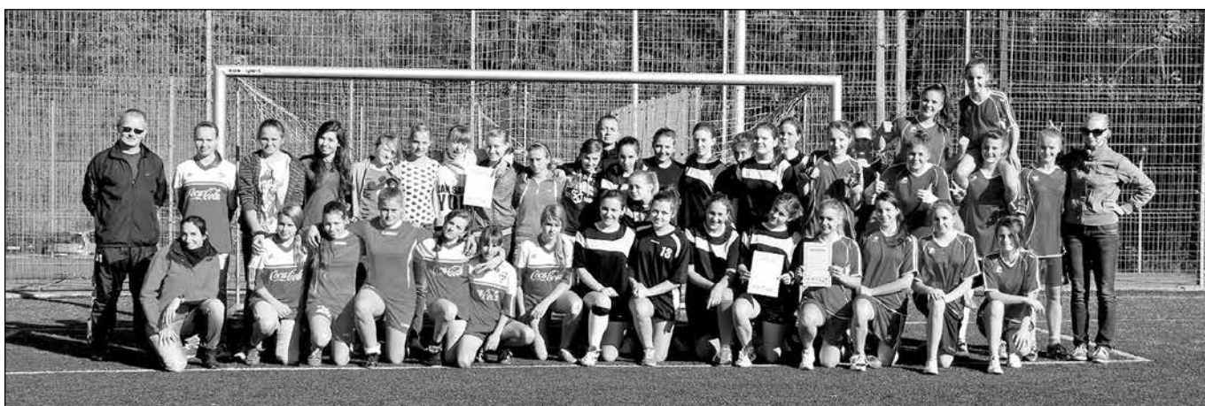
Uczestniczki Turnieju z opiekunami...