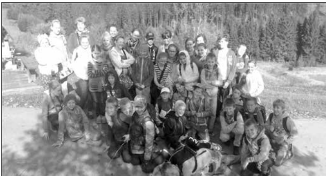
Klasa V a i V b na Jasnowicach. Choć kilka kilometrów za nami to hucmory dopisują