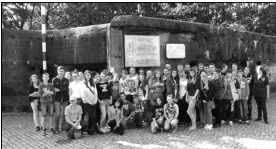
Klasy: III d i III e przed schronem „Wędrowiec”