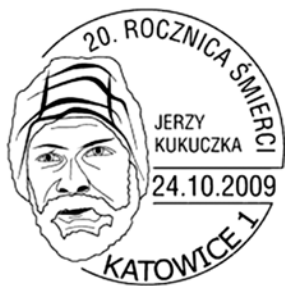
Datownik okolicznościowy z okazji 20 rocznicy śmierci