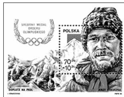
Znaczek w bloku wydany przez Poczta Polską w roku 1988.