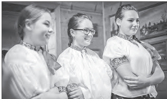
Grupa Śpiewacza „Koniaków”