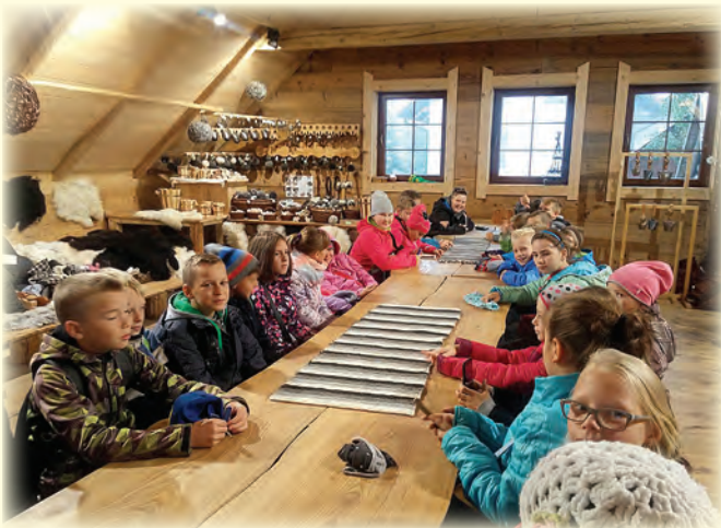
Dzień Regionalny SP 1 w Jaworzynie