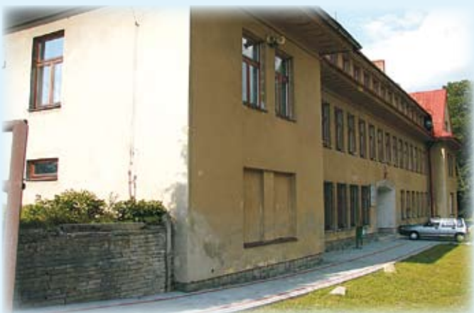
SP 2 Zapasieki - elewacja frontowa przed rozpoczęciem robót.