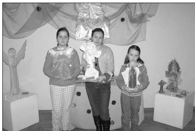
Laureatki konkursu ze swoimi aniołami.

Serdeczne podziękowanie dla sklepu Sekret z Istebnej za ufundowanie części nagród.