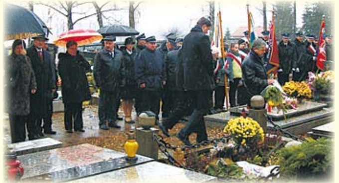
Składanie kwiatów na grobach pomordowanych.