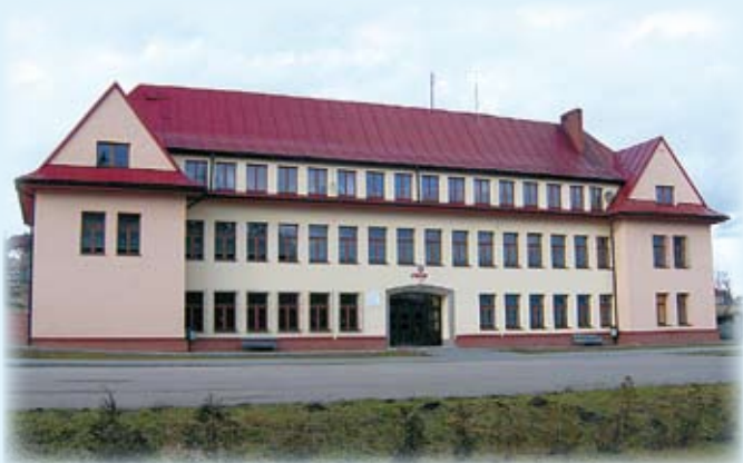
SP 2 Zapasieki - po zakończonym remoncie.