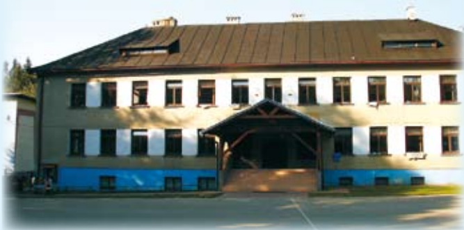
SP 2 Rastoka - przed rozpoczęciem robót.