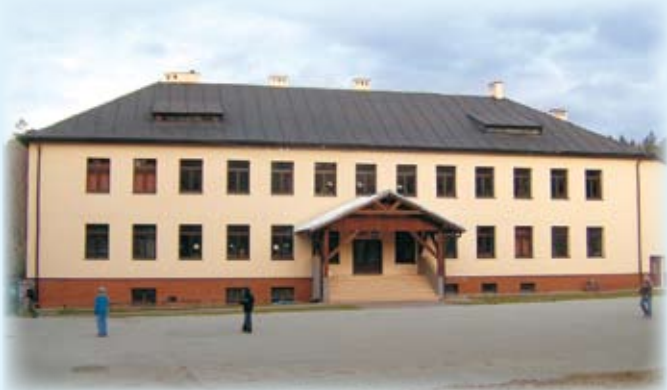
SP 2 Rastoka - w trakcie realizacji.