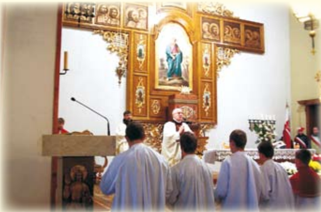
Uroczysta msza św. w intencji Ojczyzny w kościele pw. św. Bartłomieja w Koniakowie.