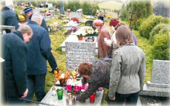
Przy grobie pierwszej ofiary wojny w Istebnej.