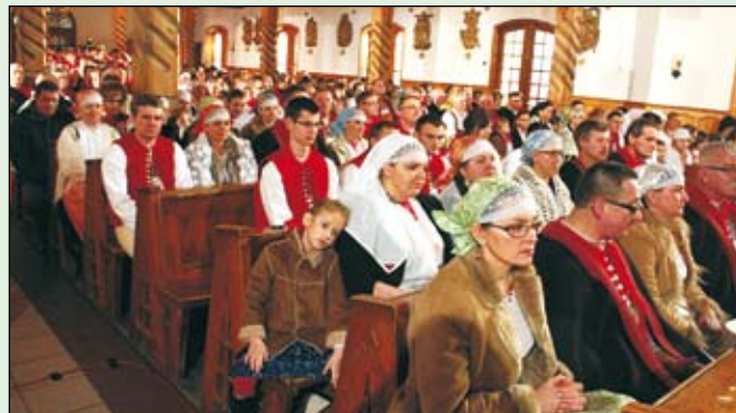
Górale w strojach podczas mszy transmitowanej przez TVP Polonia