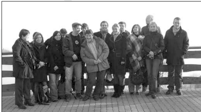
Goście z Alzacji we Francji u stóp Ochodzitej

Z kolei w ostatni dzień starego roku telewizja TVN24 przeprowadzała relacje na żywo wprost ze stoku Złotego Gronia, gdzie w tym dniu szusował Prezydent Komorowski.