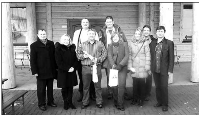
Goście z Republiki Południowej Afryki w Istebnej

Warto też dodać, iż w ostatnim czasie odwiedziły naszą gminę delegacje z Francji, Republiki Południowej Afryki oraz po raz kolejny z Republiki Chińskiej. Goście z RPA po raz pierwszy w życiu mieli okazję jeździć na sankach i nartach, a część z nich pierwszy raz w życiu widziała śnieg na własne oczy. Wszyscy jednogłośnie potwierdzają piękno naszych terenów i gościnność mieszkańców.