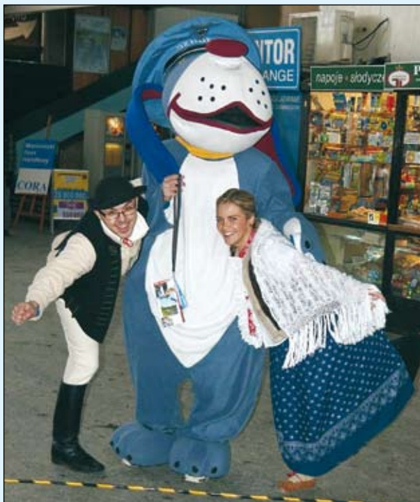
Prowadzący ze Sznupkiem - policyjną maskotką