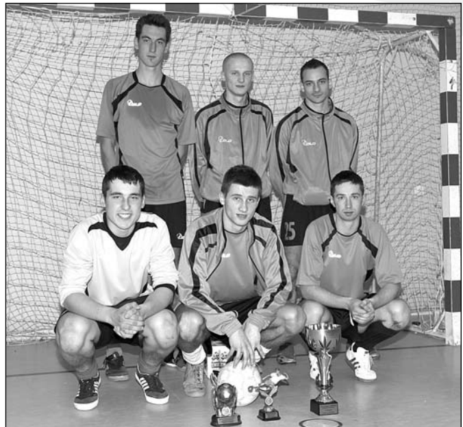
Siła Jasnowice - triumfator Memoriału